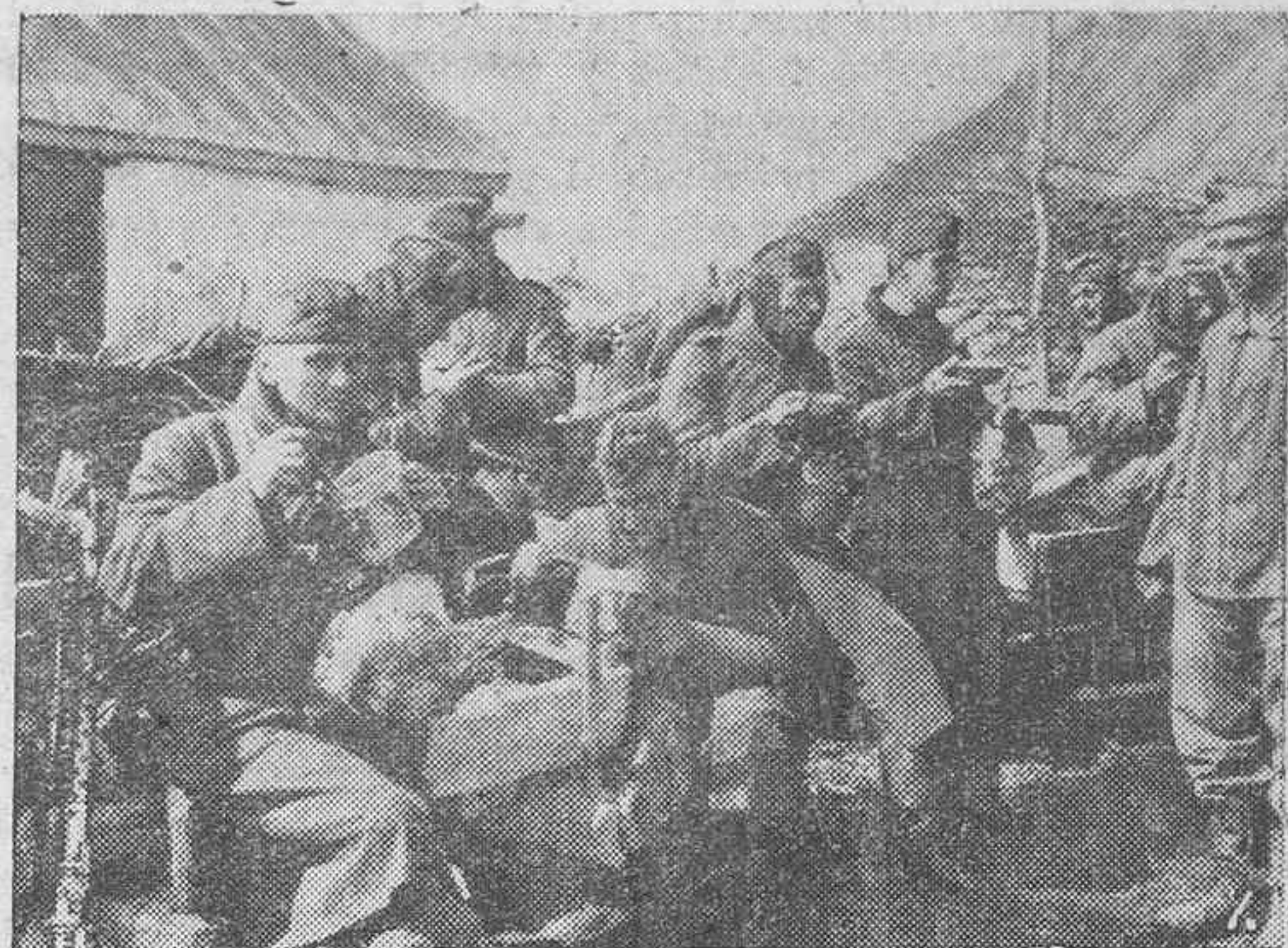
En una aldea del Dnepr que se encuentra en el camino al frente, un destacamento alemán hace alto para reorganizar las fuerzas.

Von Mackensen, embajador de Alemania en Roma y Dino Alfieri, embajador de Italia en Berlín, estuvieron igualmente presentes en la entrevista.—(Efe).