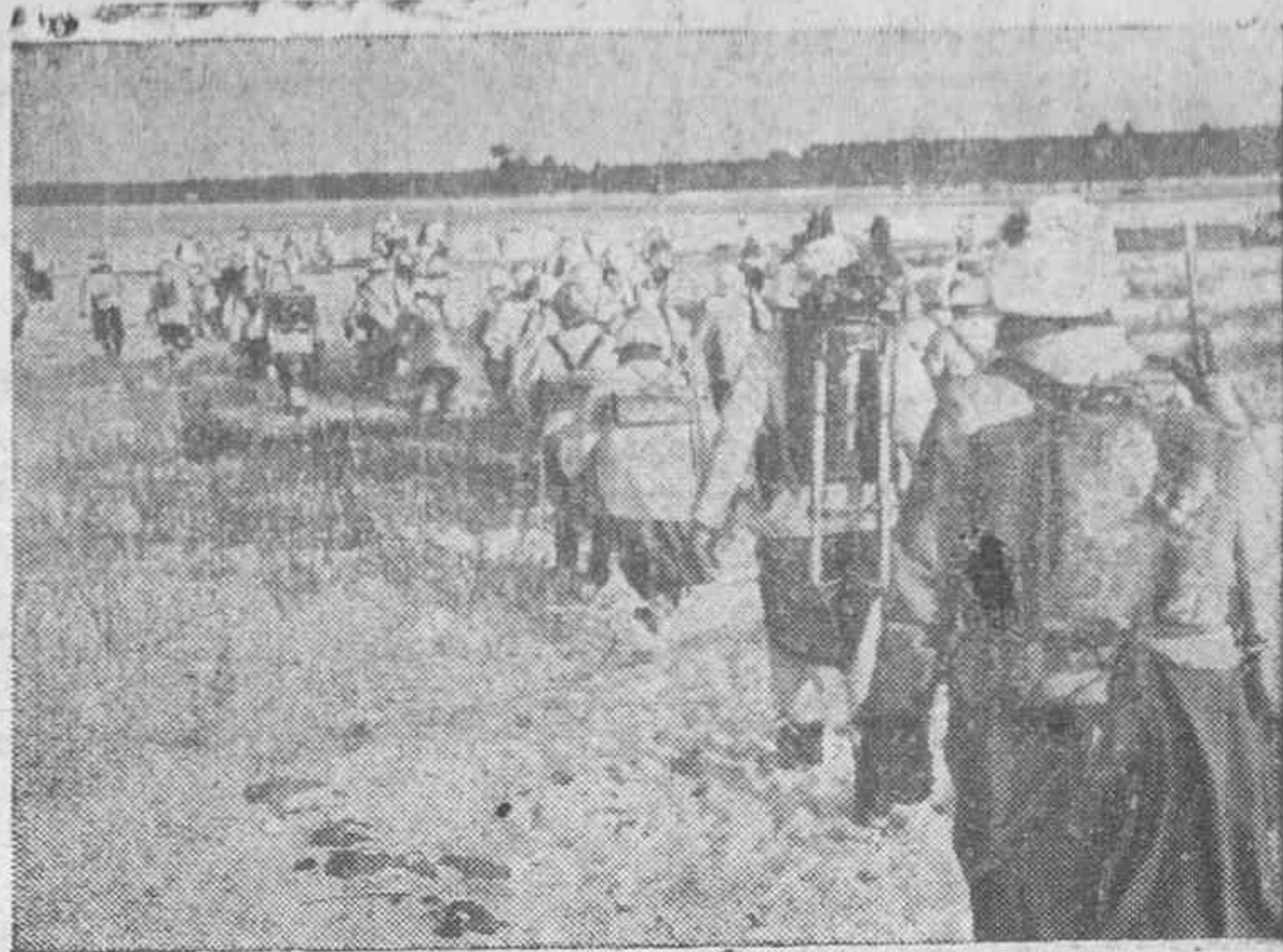
Con los soldados alemanes en el frente del Este.—Infantería alemana camuflada en marcha hacia la posición que les ha sido ordenada por el mando.

La Isla filipina de Cebú, segunda en población