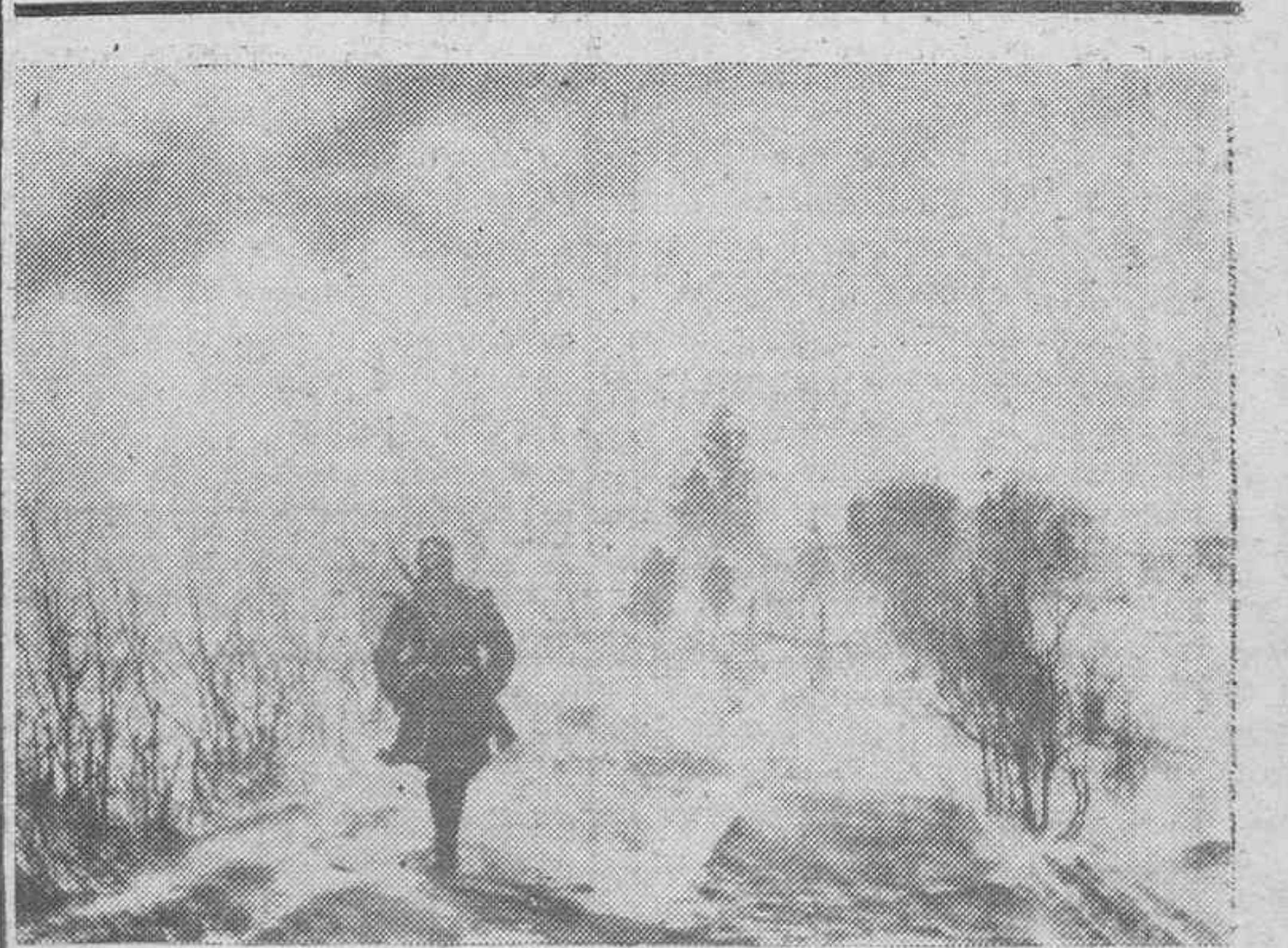
A través de la tempestad de nieve los relevos avanzan con dificultad.

Poco después se reunieron el Caudillo y autoridades en un almuerzo íntimo, y por la tarde S. E., acompañado de las autoridades militares giró una visita a los Cuarteles de la guarnición.—(Cifra).