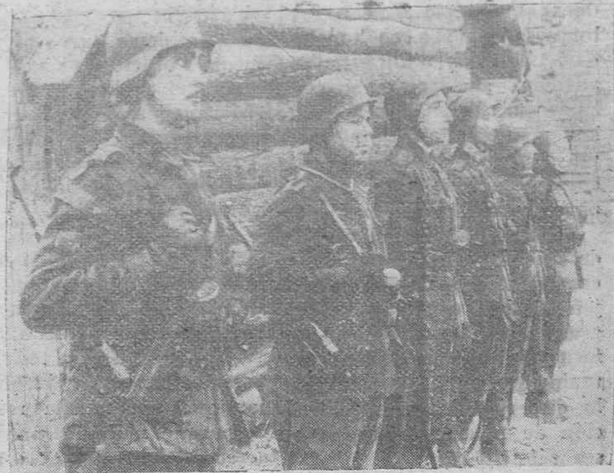
Miembros de la División Azul, condecorados, por sus hechos heroicos en lucha contra los soviets, con la Cruz de Hierro, se encuentran aquí formados para serles impuesta la Laureada Colectiva.

Ante nuestros ojos atónitos han desfilado los paisajes. Pasaron disciplinadamente por orden de estatuas. Ahora las marcas bálticas. Aquí comienza lo subjetivo a liberarse. Por tanto, dejamos de ser imparciales deliberadamente. Somos ya sujeto sustantivo. La horda roja dominó estas tierras frágiles, que no supieron resistir la brutalidad de la cabalgada asiática. Toda esa teoría comunista de pancartas y "affiches" aún no despegados de los heridos muros, nos ofende y despierta. Vemos los primeros judíos, nuncio humanizado del próximo enemigo. Ahora reconozco que la Etnología sea una ciencia, pero de esencia fácil; es sencillo reconocer a los semitas. Los de aquí, en estas villas fronterizas al frente de combate, tienen aire de perros asustados; ceden el paso siempre y hablan "sotto voce". No les está permitido entrar en los cafés que frecuentan los soldados del Reich y a alta