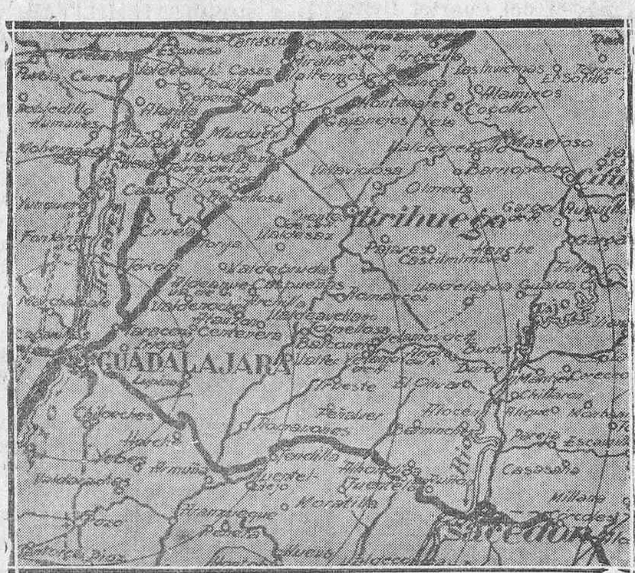
El sector de Guadalajara, donde nuestras tropas están realizando un avance victorioso.

En Brihuega dejaron muchos prisioneros, entre ellos un capitán y dos tenientes. En Jadraque cogimos un copioso botín al enemigo; fusiles