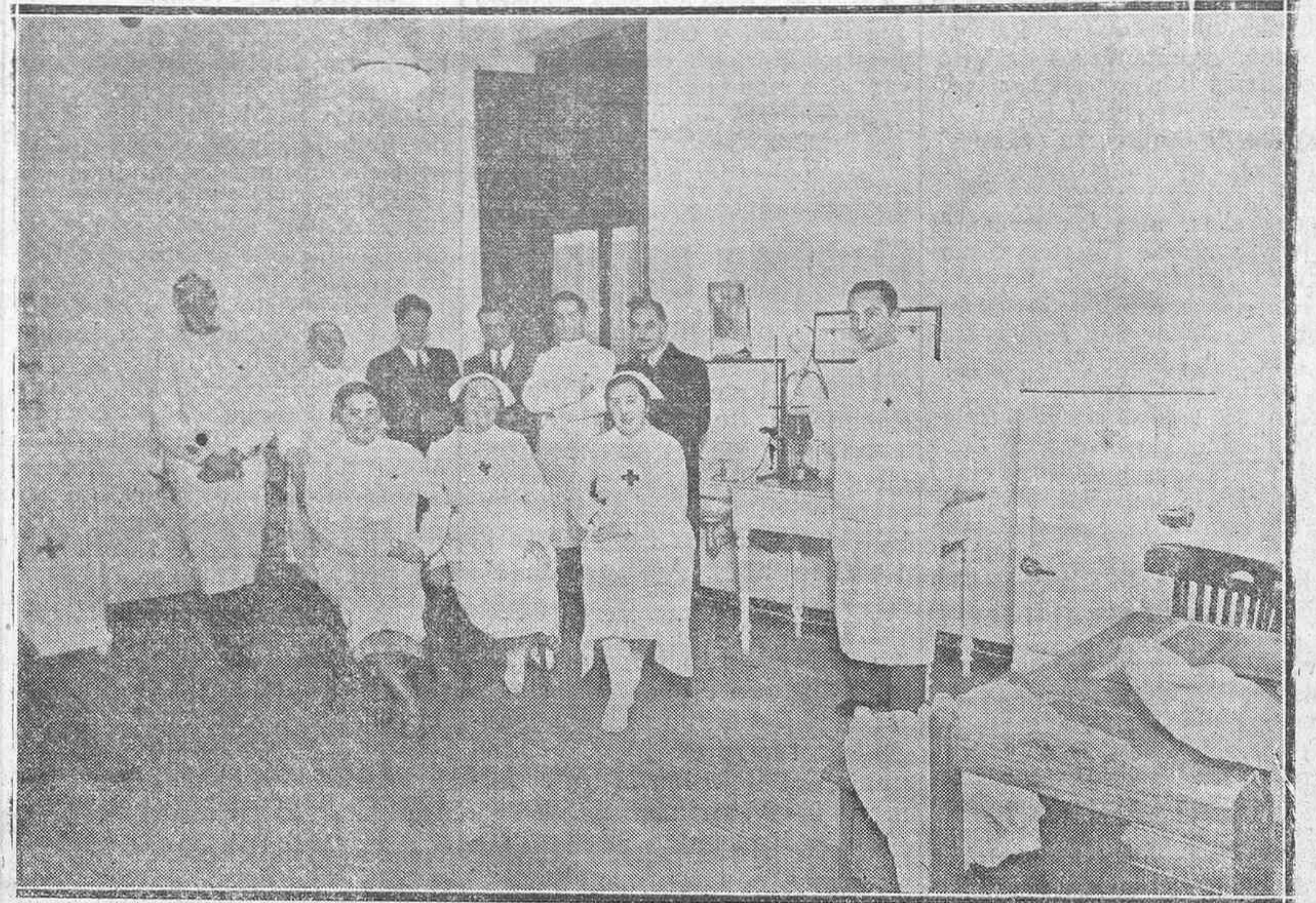
Equipo de médicos y damas enfermeras que intervienen en las transfusiones de sangre del Seminario.

Que este año no haya zapatillas de abrigo. Las mejores marcas en las variaciones y novedades más extensas y modernas, las encontrará de todos los precios y tamaños en la casa de ANSELMO MORENO Teléfono, 1696. Constitución, 9