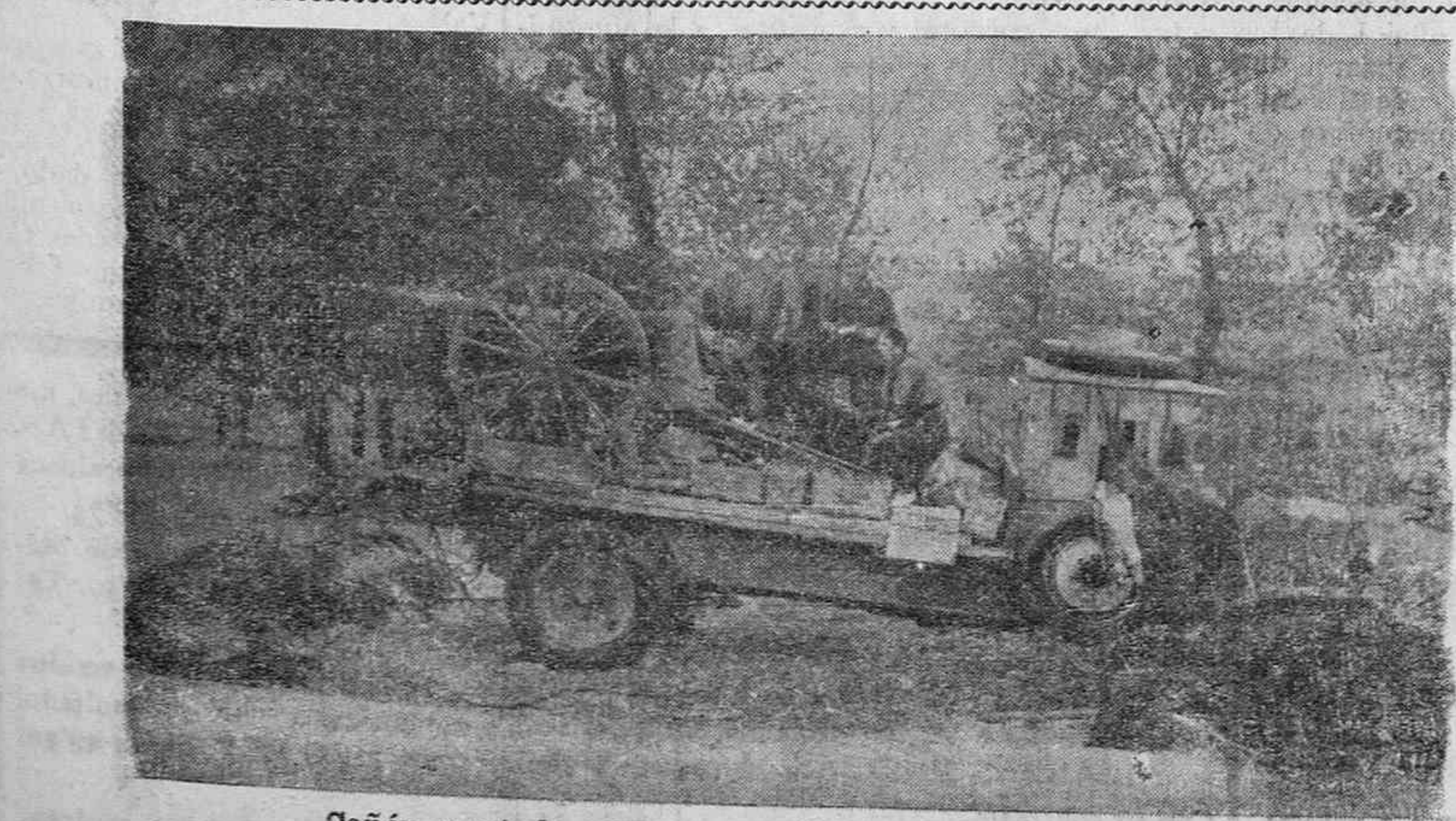
Cañón montado sobre un camión en un puesto de Somosierra

Organizado por las Margaritas-Requetés, y de acuerdo con las restantes organizaciones tradicionalistas, mañana martes, a las ocho de la noche, en la iglesia de las Reverendas Madres Brigidas, se rezará un solemne Vía-Crucis por España, al que quedan invitados todos los fieles.