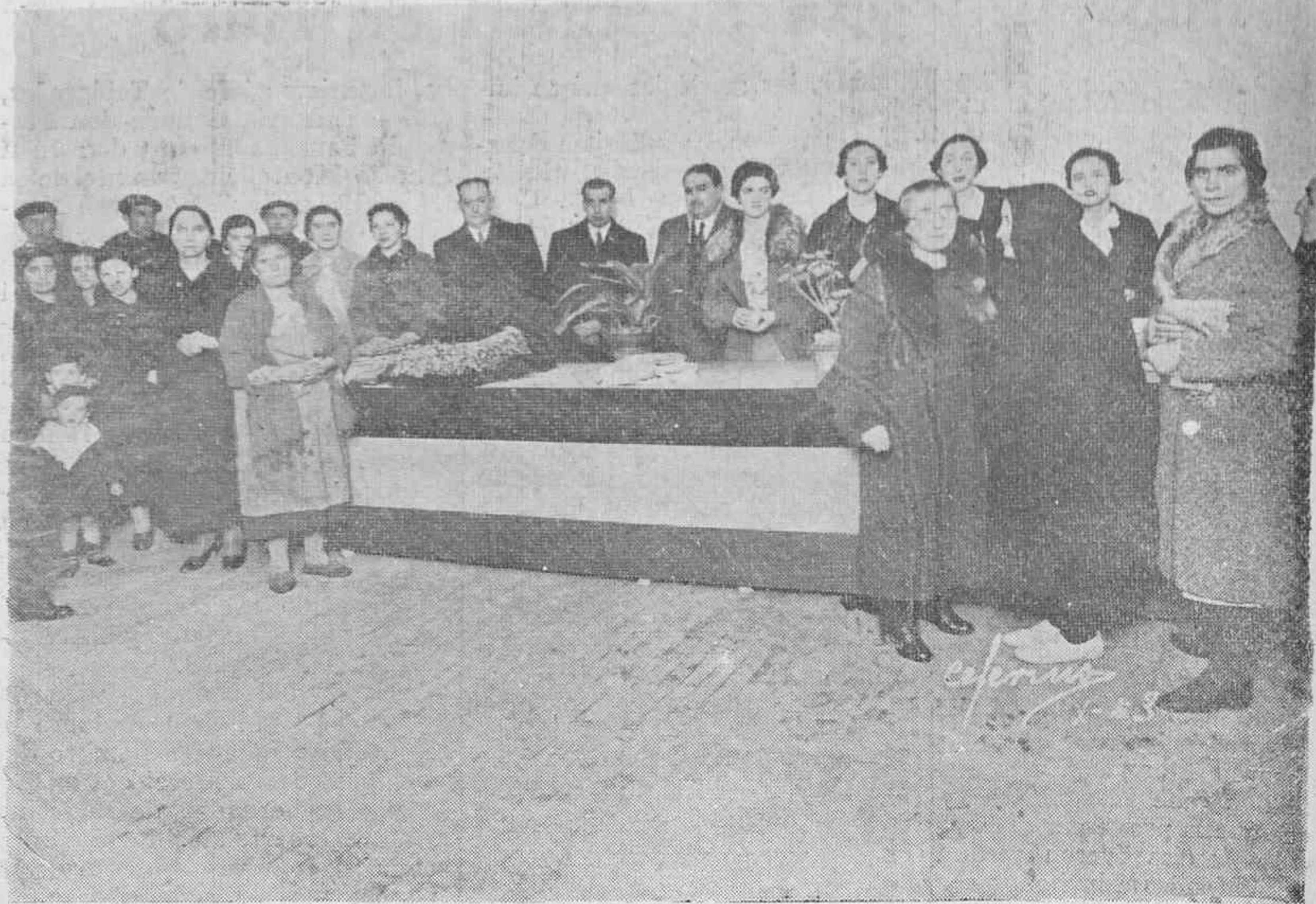
Las autoridades de Alava presencian el reparto de ropas hecho ayer en Haro con motivo de la inauguración de la Caja Provincial de Ahorros de Alava en aquella localidad riojana.