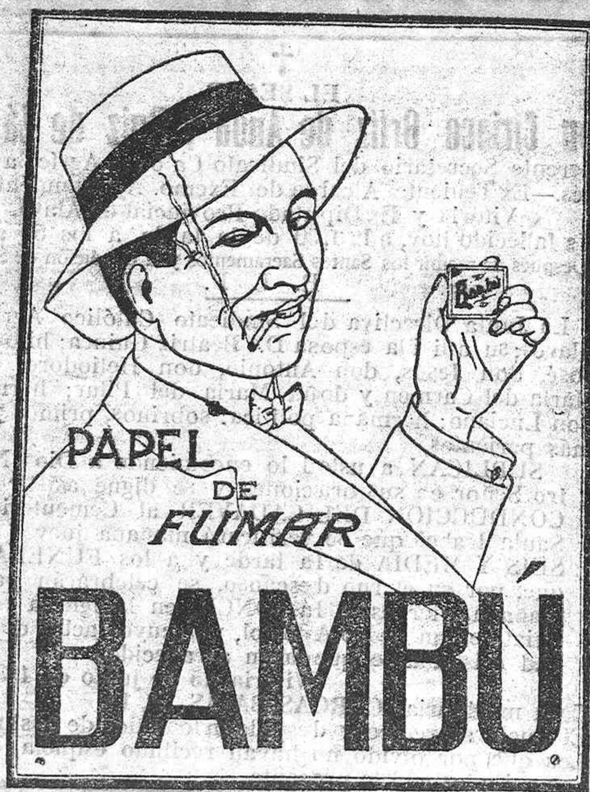
Ha obtenido gran premio en la Exposición Internacional de Barcelona 1929