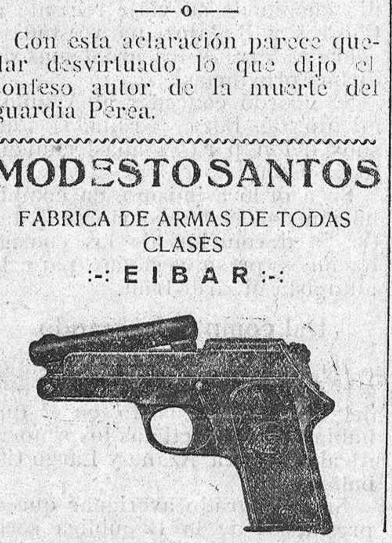
Pistola "Sharp-Sooter" la mejor hasta el día conocida en España

FABRICA DE ARMAS DE TODAS CLASES ::: E I B A R :::