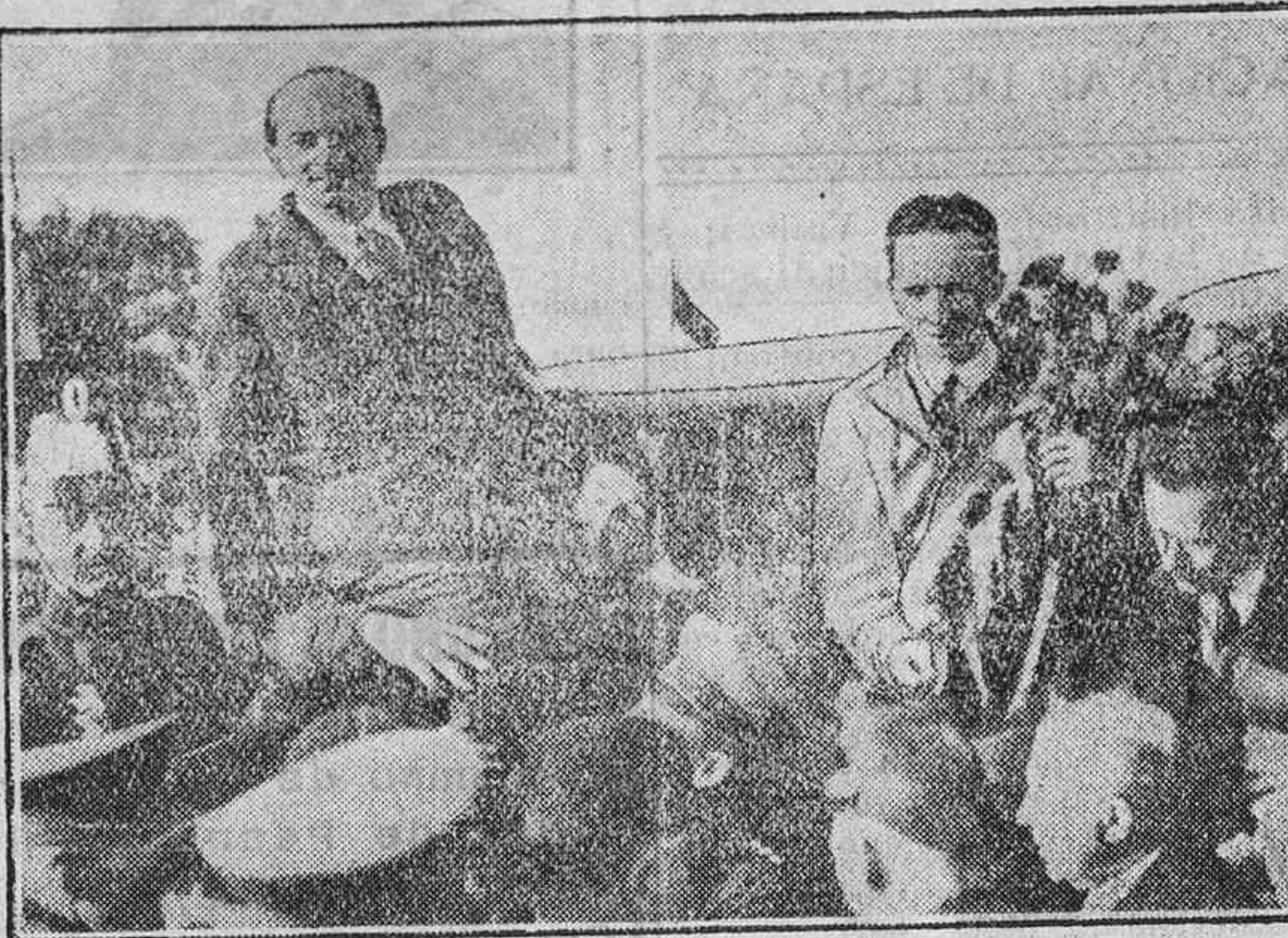
He aquí a los dos héroes de la décima travesía aérea del Atlántico M. Levine y el aviador Clarence Chamberlain, llevados en triunfo por la multitud apenas aterrizaron en el aerodromo de Tempelhof Feld.