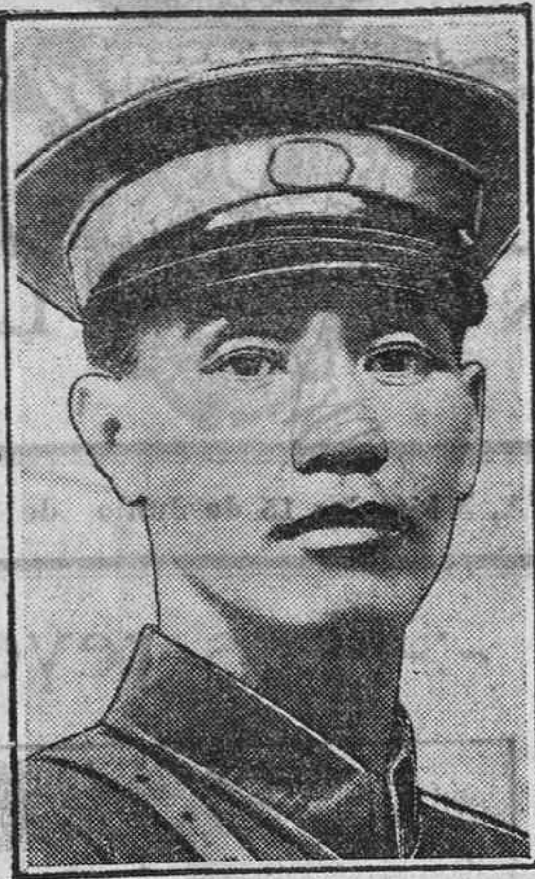
CHANG KAI CHEK

V. CORRAL MÉDICO ☞ ☞ RAYOS X ☞ ☞ Consulta de 11 a 1 y de 3 a 5. DATO, 25, 1.ª derecha.