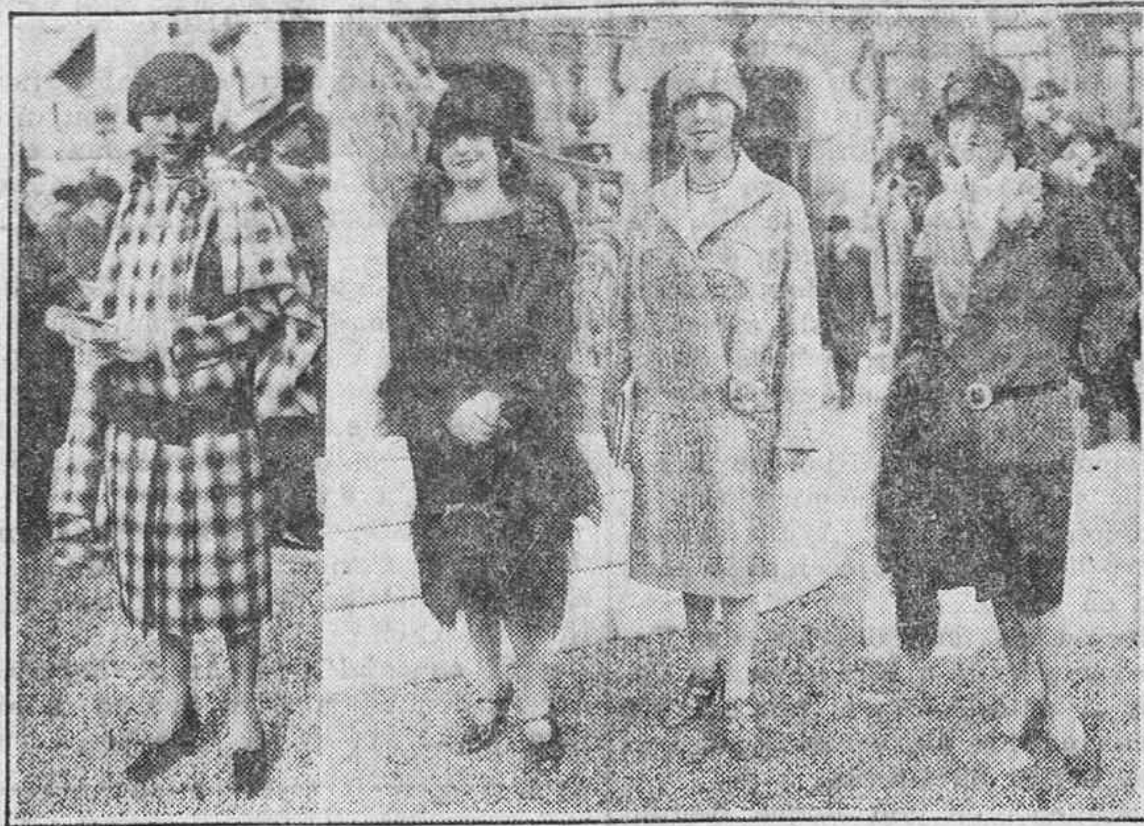
LA MODA EN PARIS

En el Hipódromo de Longchamp, punto de reunión de la elegancia parisina, se han reanudado las carreras en tarde de sol. He aquí tres de los más vistosos modelos admirados.