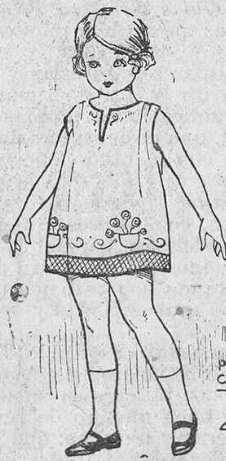
PRENSA CUEVAS MEL

modistos londinenses a higienistas, artistas y principales moralistas de In-