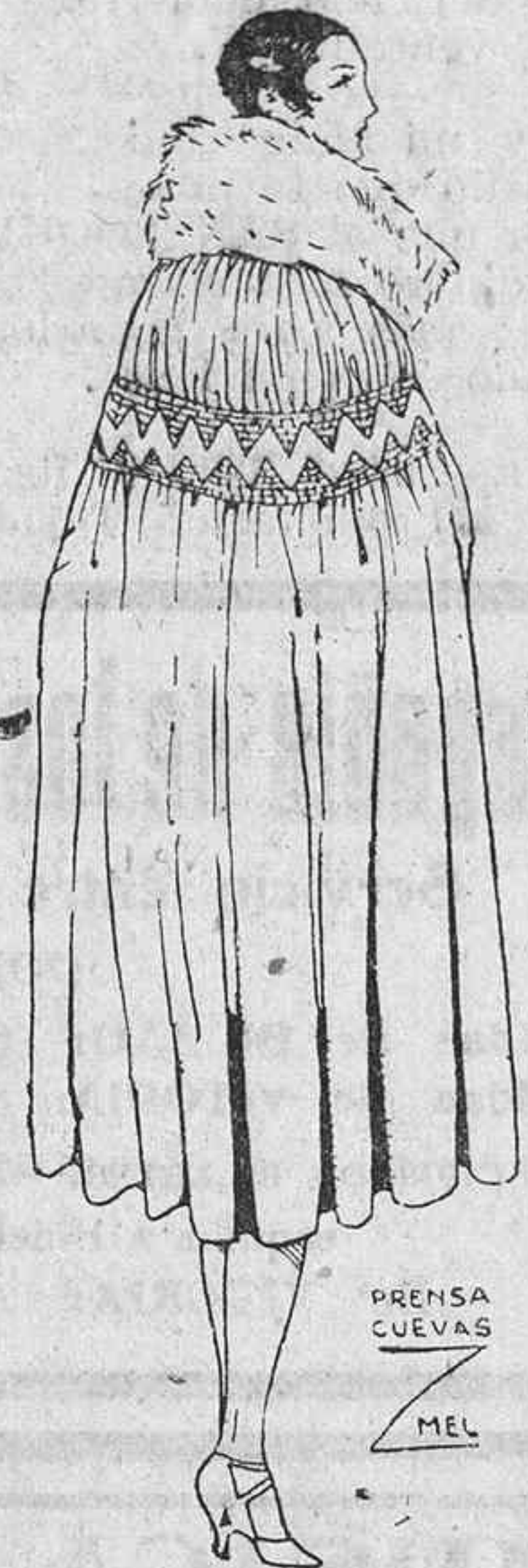
PRENSA CUEVAS MEL

—A mi edad las cosas pierden su carácter melodramático; pierde importancia todo, y todo se mira serenamente... Y es que ya no quedan en la sangre las hogueras que encienden pasiones en la juventud.