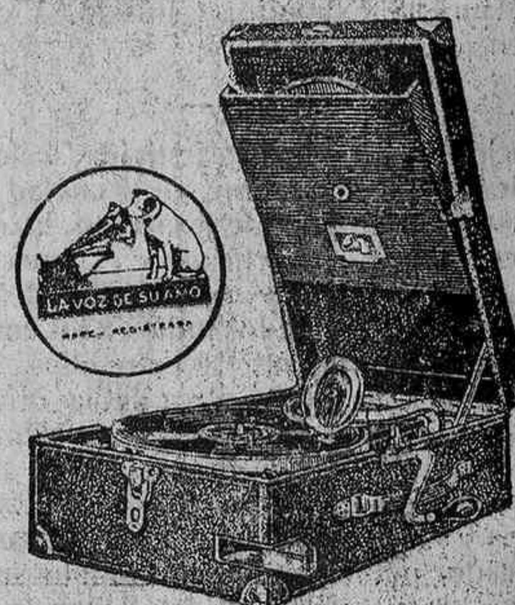
PORTATILES últimos modelos DISCOS toda novedades.

El herido ha sido trasladado a Vitoria en el coche-camilla de nuestro Laboratorio municipal.