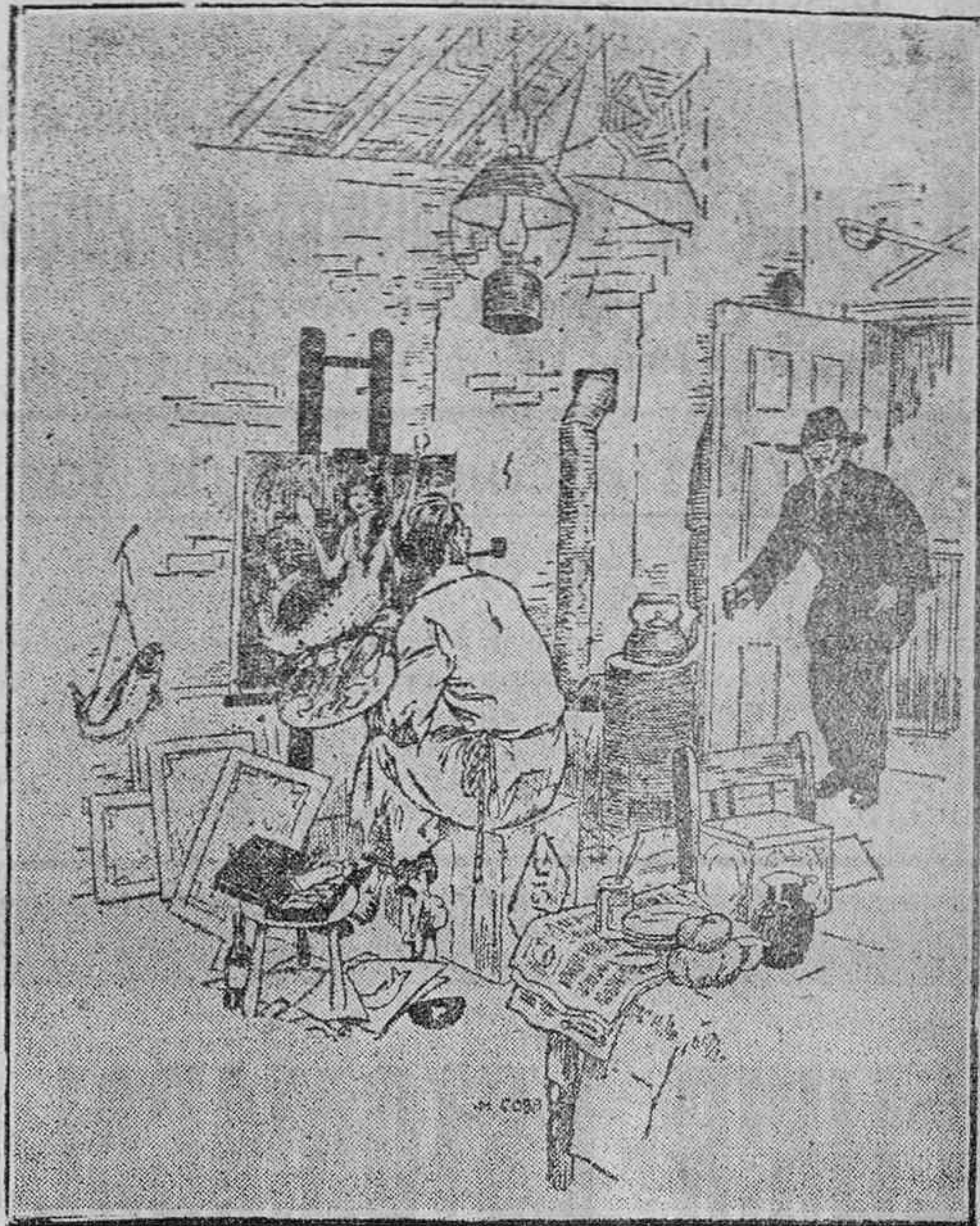
DEL HUMOR AJENO