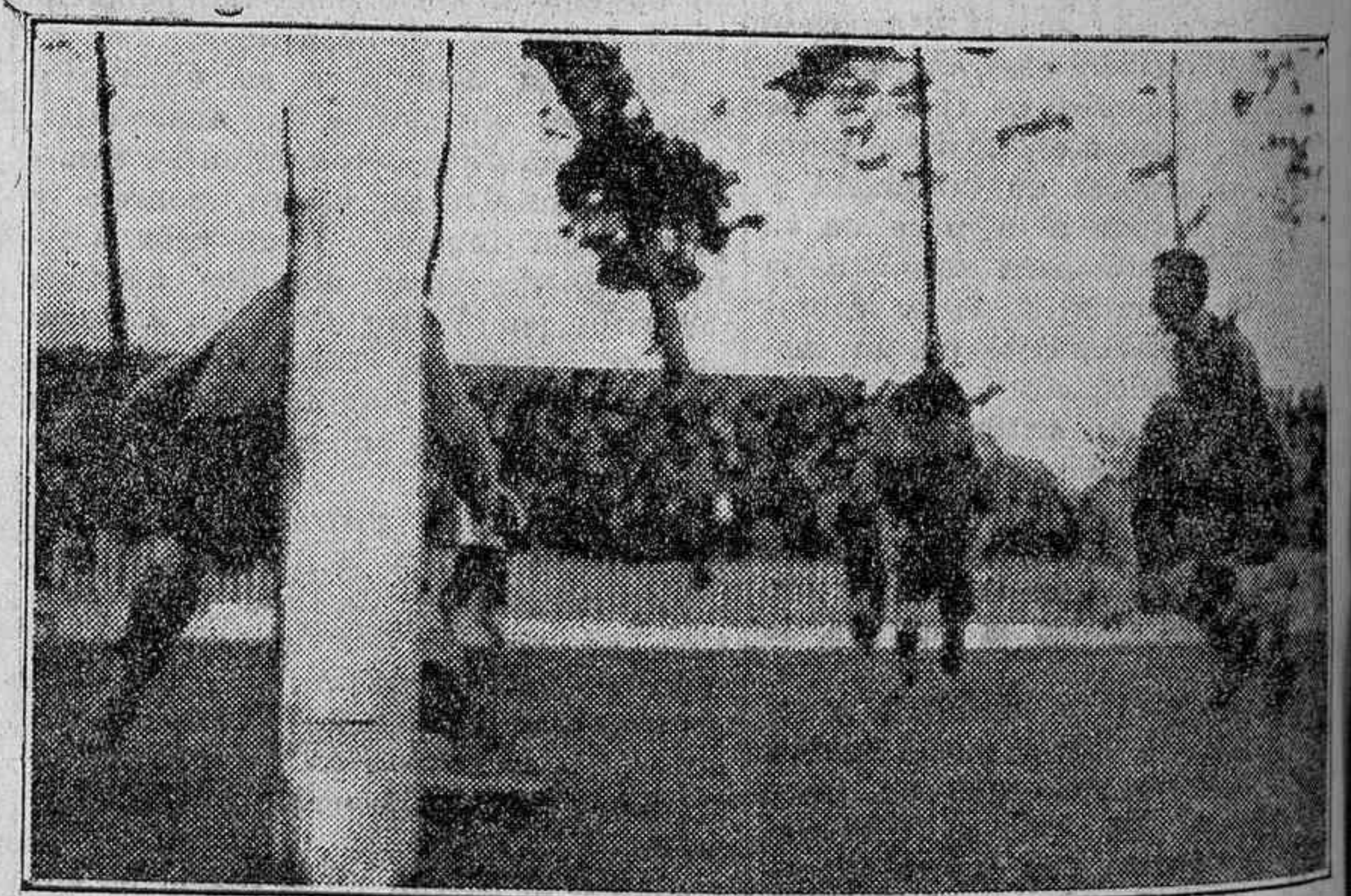
EL MEJOR REMATE DE UNAMUNO QUE NO FUE, SIN EMBARGO, TANTO.

Arenas: Urbarri; Llantada, Careaga; Laña, Urresti, Fidel; Gurruchaga, Rivero, Yermo, Robus y Crispulo.