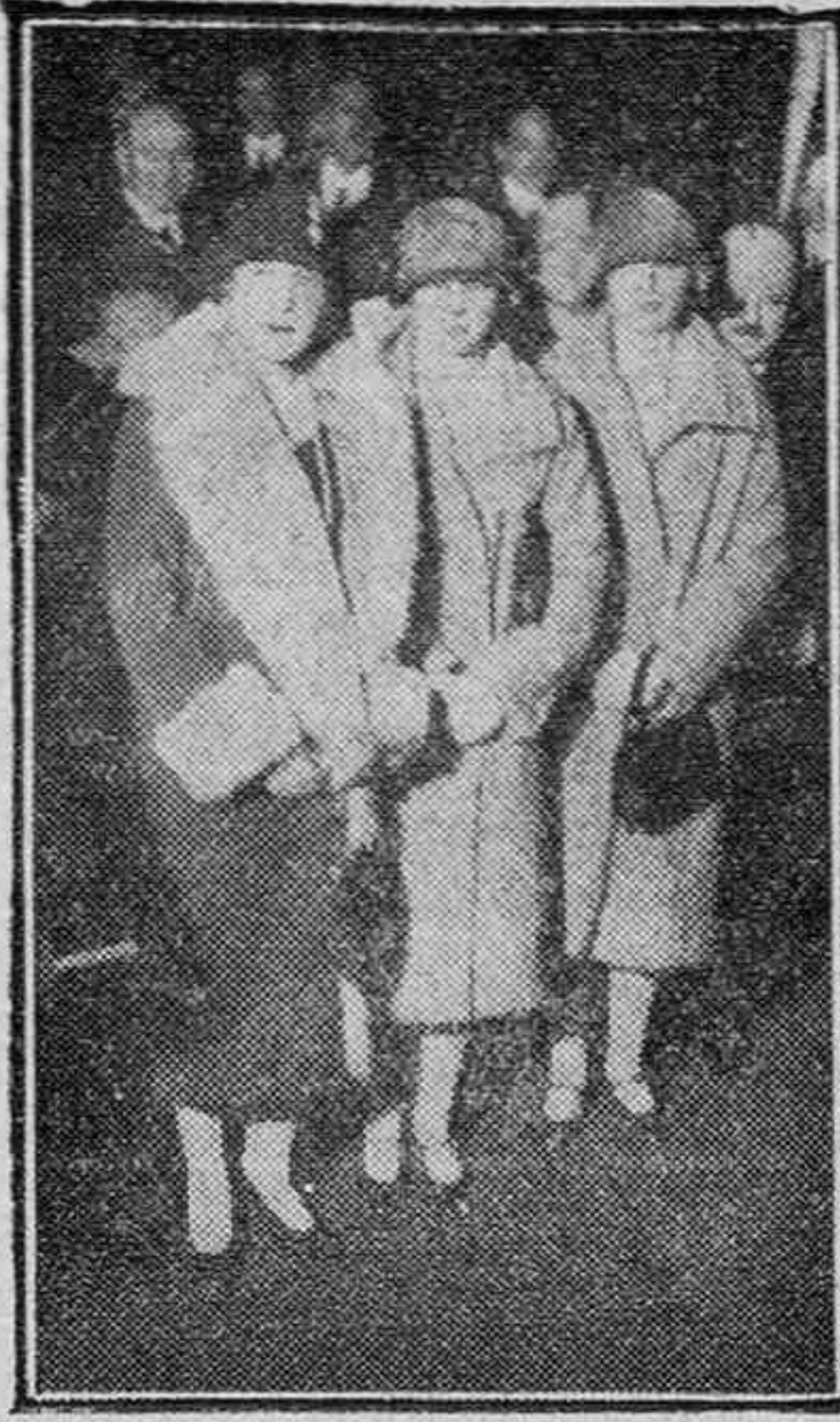
Su Majestad la Reina doña Victoria Eugenia, acompañada de las infantas doña Beatriz y doña María Cristina a su llegada a París.