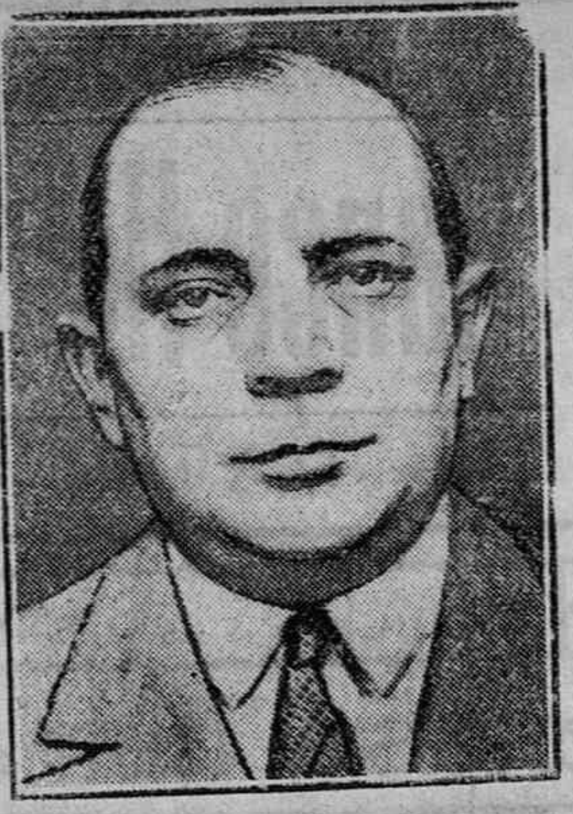
UN ESTAFADOR FAMOSO

Una de las causas que han contribuido al alejamiento del público del Oficio de Vísperas, es sin duda ninguna, la hora verdaderamente intempestiva en los actuales tiempos, en la que ésta parte del Oficio divino solía celebrarse; ella era la dedicada al