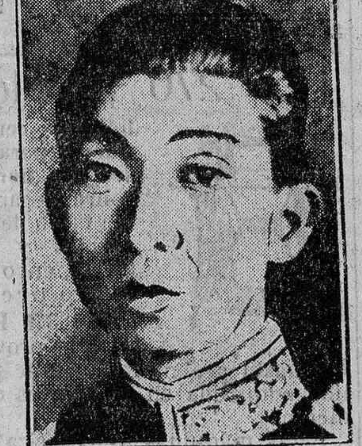
El príncipe Takamatsu, hijo del Mikado, que Hegará a Francia después de celebrarse su próximo matrimonio con la hija del príncipe Tokugawa.