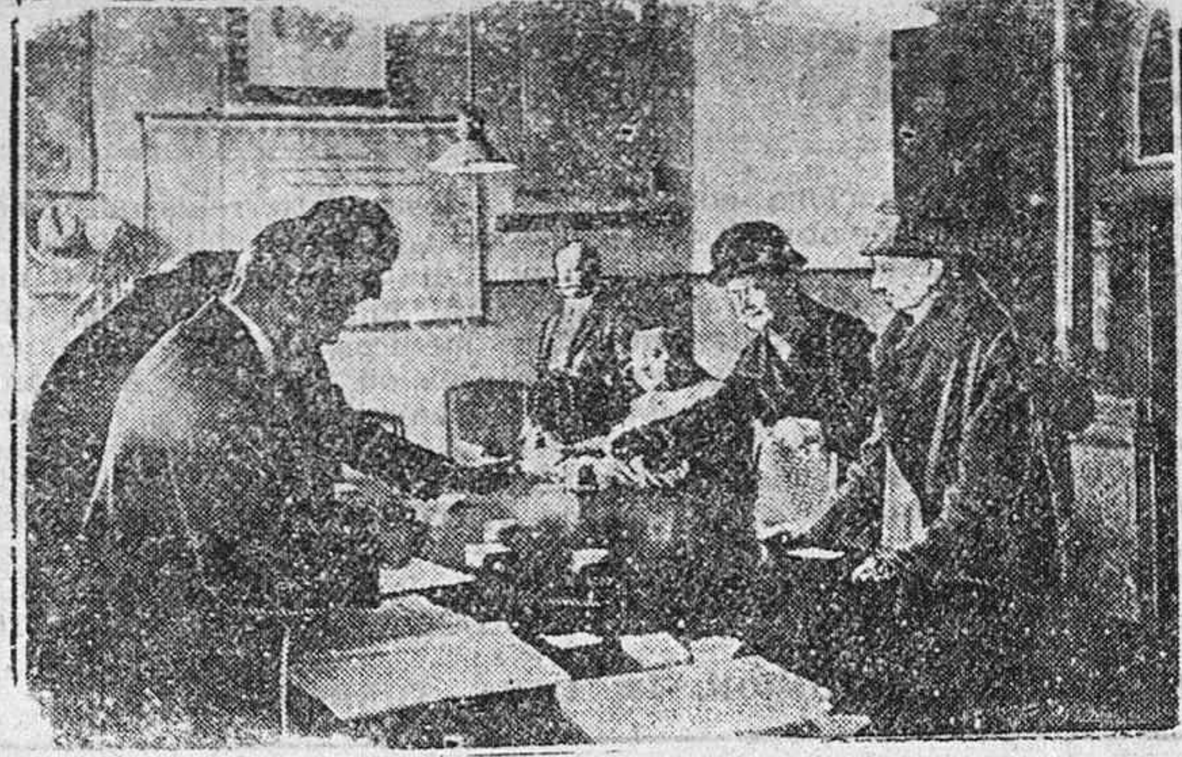
Ante las elecciones alemanas

Toda Alemania se prepara para las próximas elecciones, en las cuales van a participar también las mujeres. Nuestro grabado presenta a dos damas haciendo comprobar su condición de electoras en la oficina correspondiente.