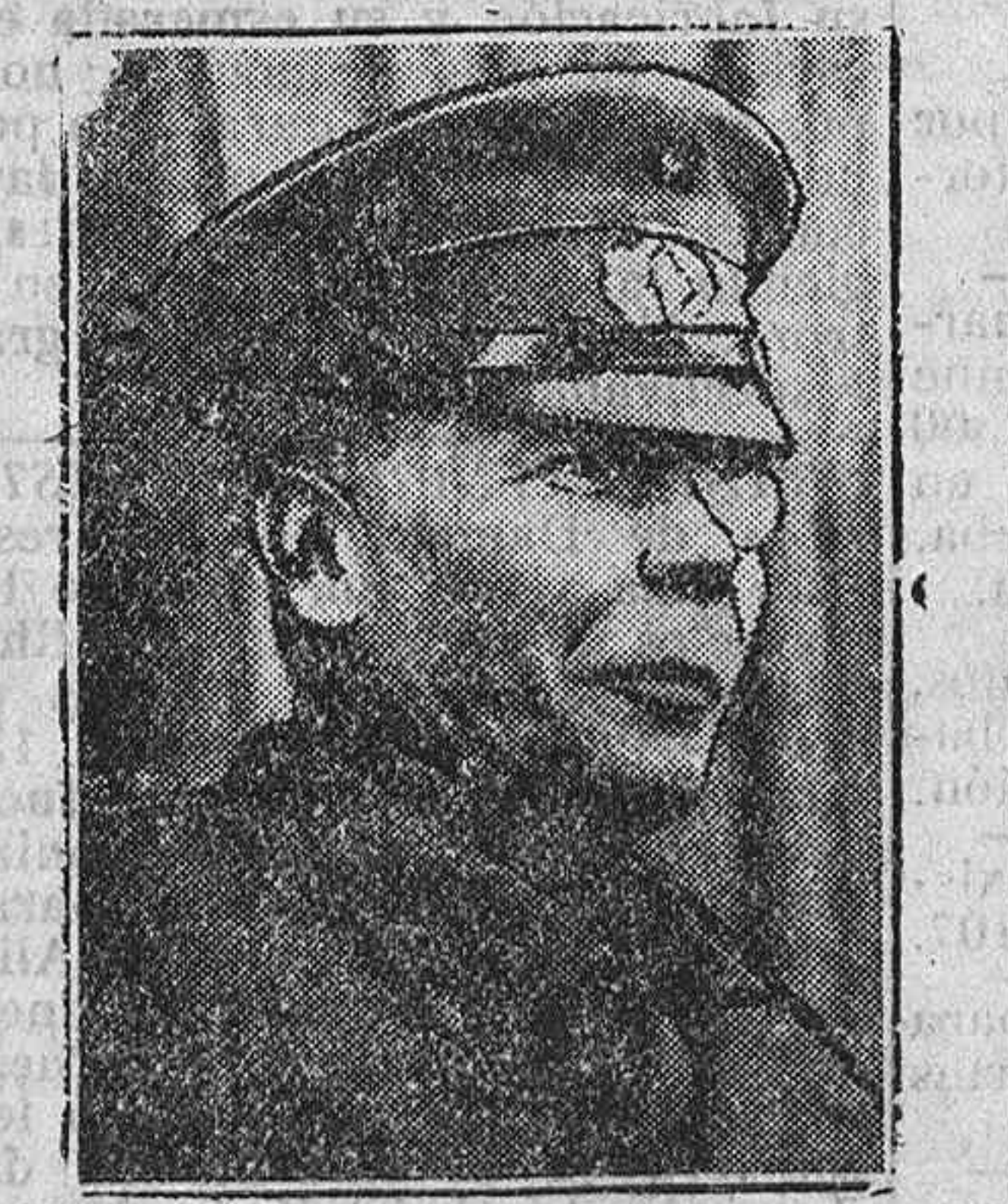
EL GENERAL VON SEEKT que se presentará en las próximas elecciones alemanas a la cabeza de la lista de los candidatos populistas de Magdebourg.