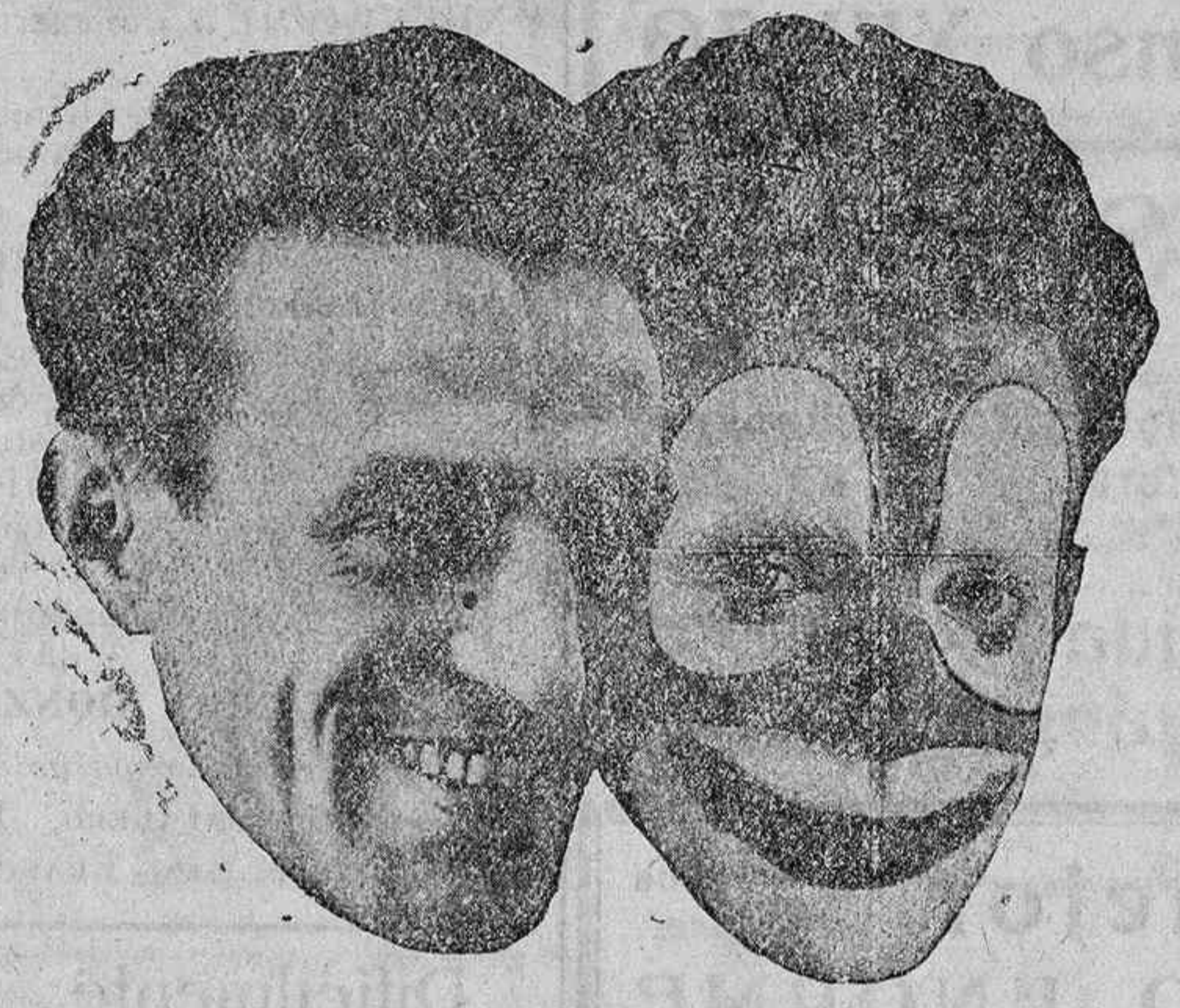
RAMPER el rey del humorismo que hoy debuta en el PRINCIPE, al frente de una compañía de varietés