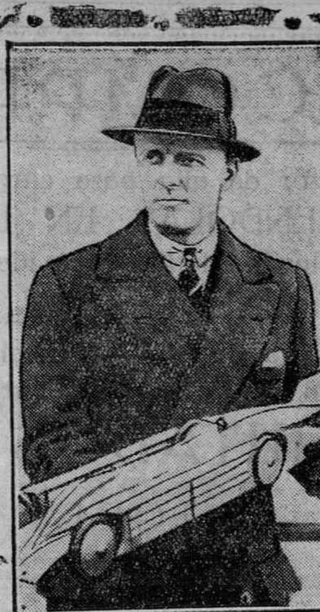
El célebre corredor británico, Mayor Segrave, con la maqueta de su automóvil con el que ha batido el record de velocidad mundial.

«El club—y te hablo como amigo antiguo—no ha realizado ninguna gestión, ni a él se han dirigido en sentido oficial para el traslado de Quinceos...»