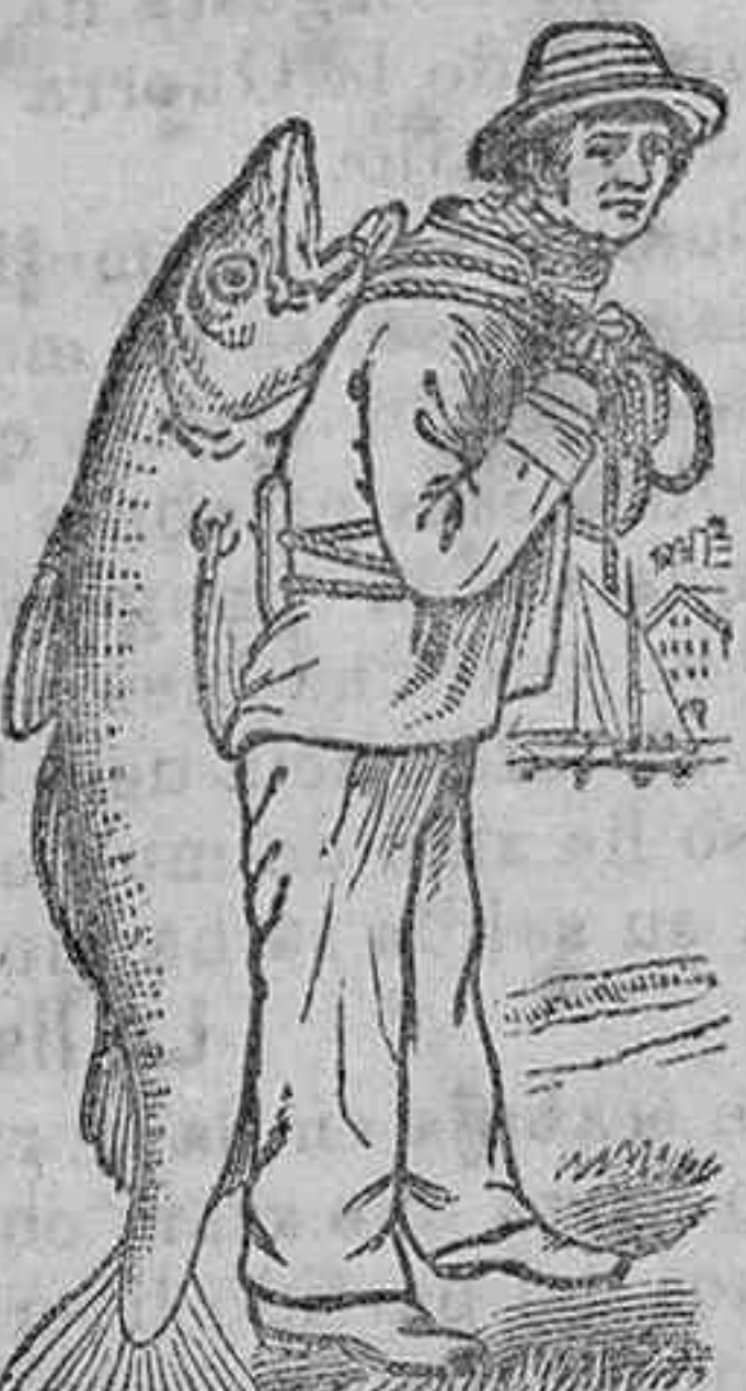
Islas de Lofoden (Noruega) 1902.

Desde muchos años yo pescó para ustedes el mejor bacalao que nada en estos mares, y este bacalao de Lofoden es el mejor del mundo. De estos bacalaoes que yo pescó con anzuelos y largo carrión, yo reservo para Vds. exclusivamente los de primera calidad. En todos los años que trabajo para Vds. nunca les he dado un pescado de calidad inferior. Esta es la razón de la extraordinaria curativa del aceite que yo extraigo para Vds. de los hígados de esos pescados y siempre ha sido de primera calidad de la producción noruega, que es la más superior del mundo. Si el buen pueblo español quiere cosas de primera y no de inferior calidad, pedirá siempre la Emulsión Scott que lleva en el envoltorio la etiqueta que representa un gran bacalao de Lofoden a costas de su S. S. El Pescador.