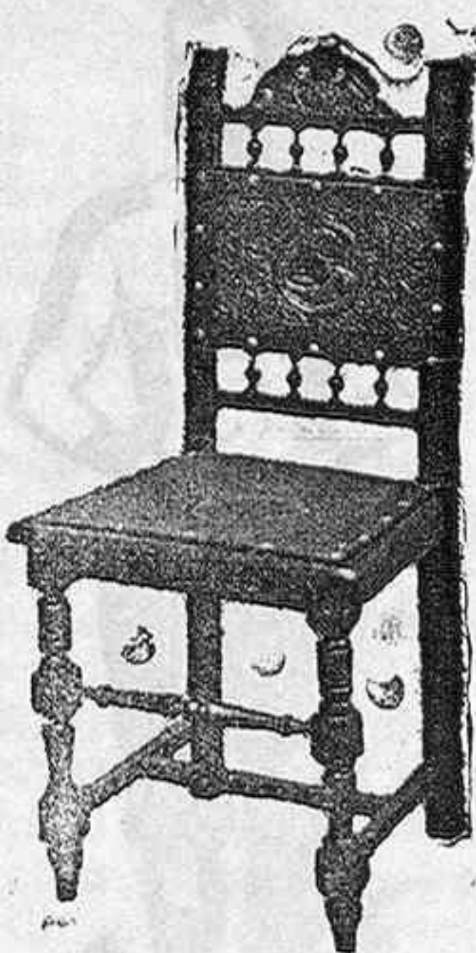
Núm. 116-SILLA color cegal de mucha aceptación por su solidez á pts. 4'25

Cama barnizada con largueros. Silla barnizada Colchón Almohada Mesa de noche. Somier Cuadro Percha. } á pesetas 34'95