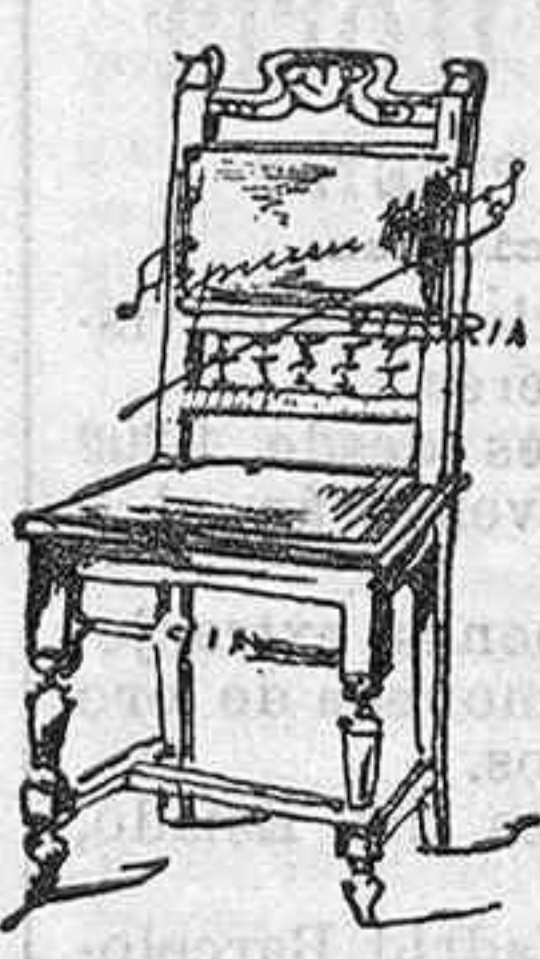
Núm. 211-Silla maderosa de haya color nogal: entapizada de moulésquin y clavos dorados: una á pts. 7 La misma con cartón cuero á 5'50 pesetas

Camas, Gergones y Somiers ESTACION 33 DE TODAS CLASES VITORIA 5.000 espejos tocador á 0'25 MIRAGUANO 2'35 Kilo