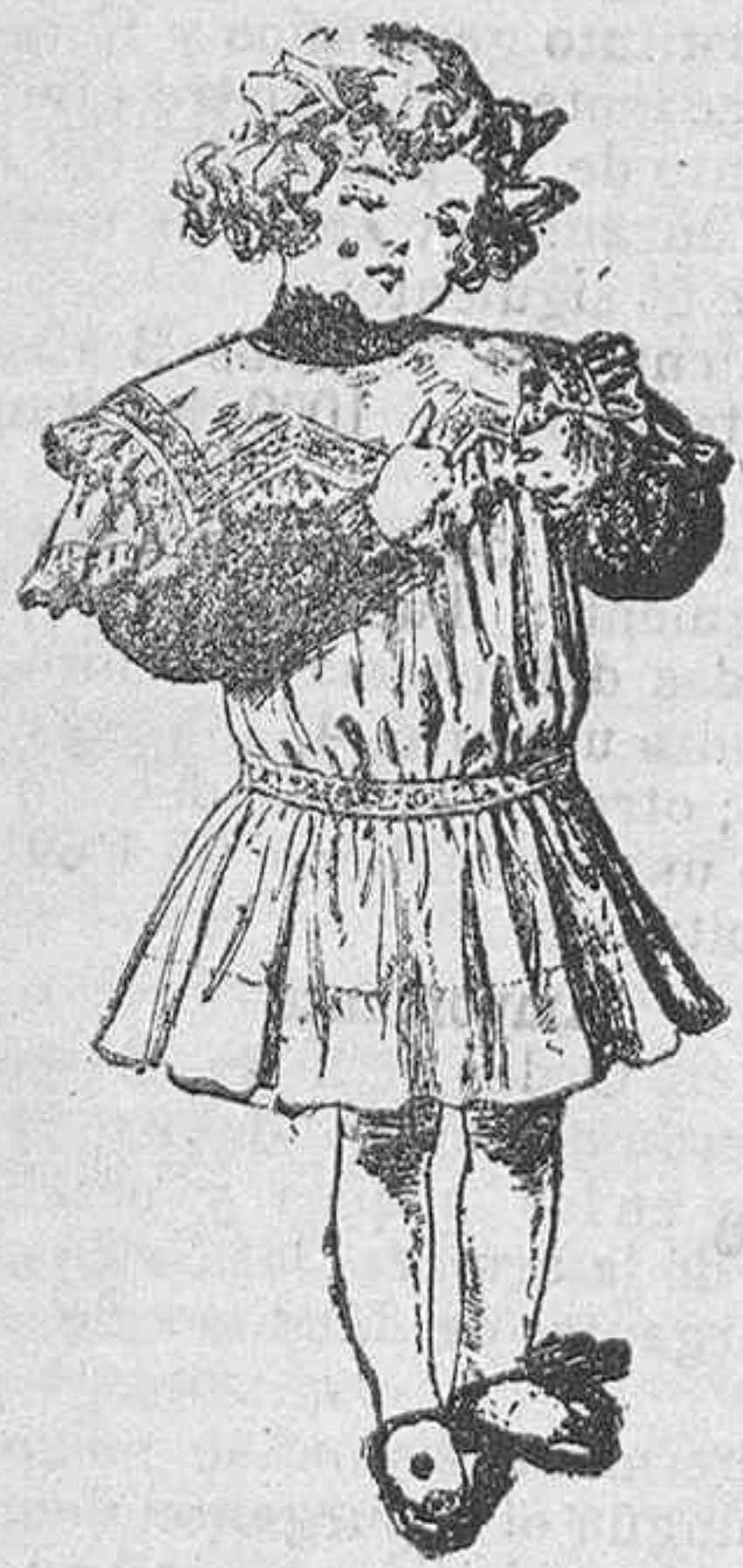
Traje delantal para niño.—Ccn

El modelo que damos es muy fino y elegante.