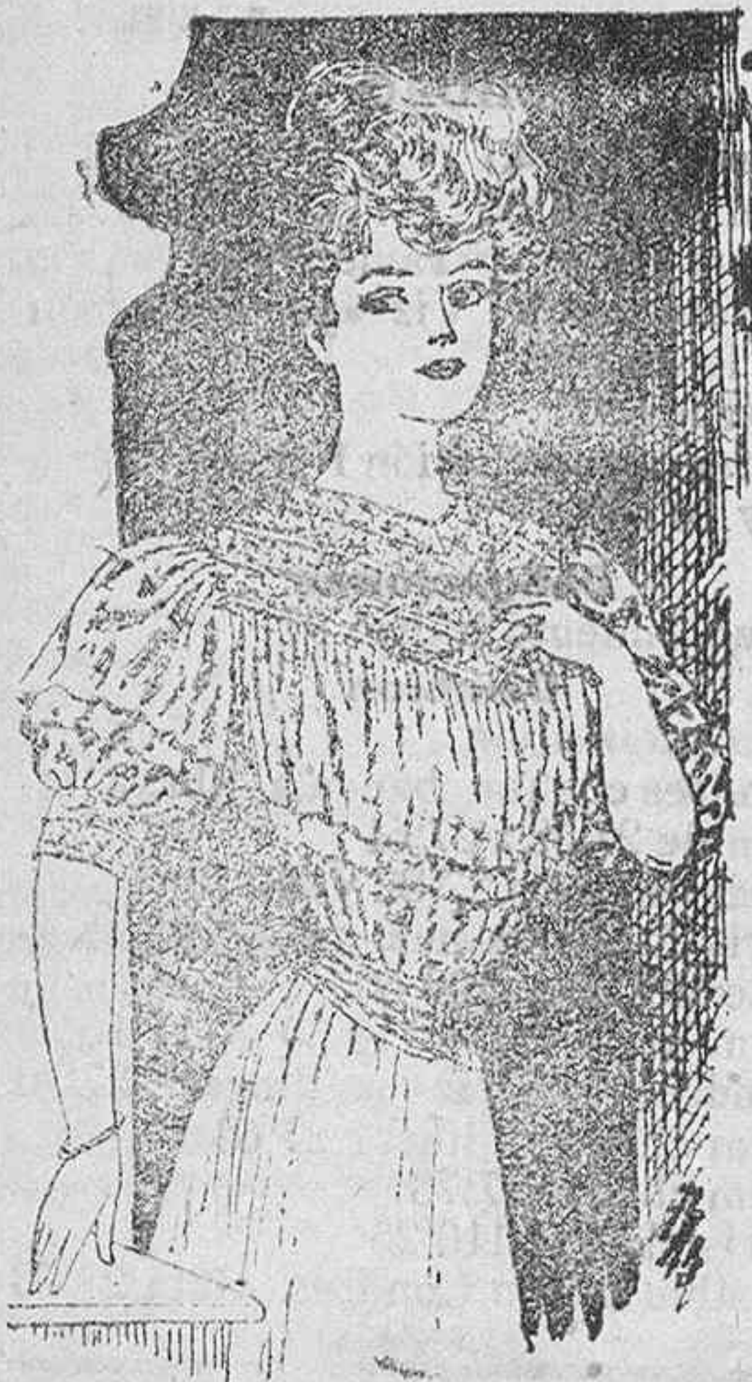
Cuerpo blusa plegada, para señoritas; se hace en velo, adornada de bordado abierto, crespón de la China y encajes madrileños.

Las blusas plegadas con adornos de encaje madrileño, son hoy de gran novedad para señoritas y este modelo da gran resultado.