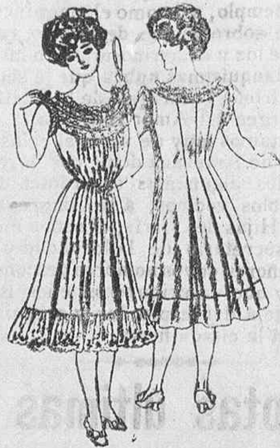
Camisa entallada, vista en dos aspectos, en batista, con volantes y encaje madrileño.

En la ropa interior, las camisas en talladas son de gran novedad, y toda señora ó señorita debe hacerse estos honestos modelos.