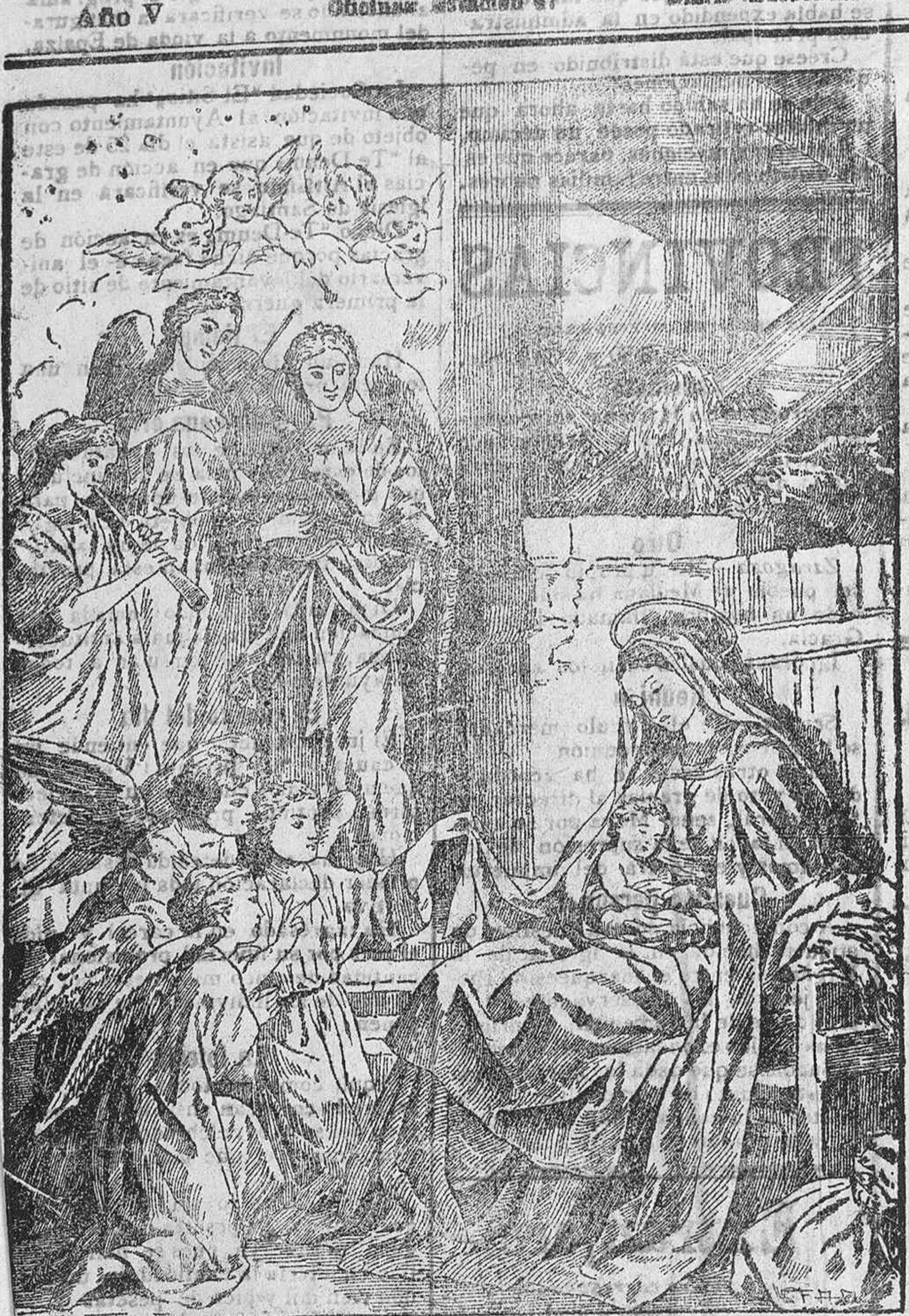
LA NATIVIDAD DE NUESTRO SEÑOR JESUCRISTO (Cuadro de Carducho)