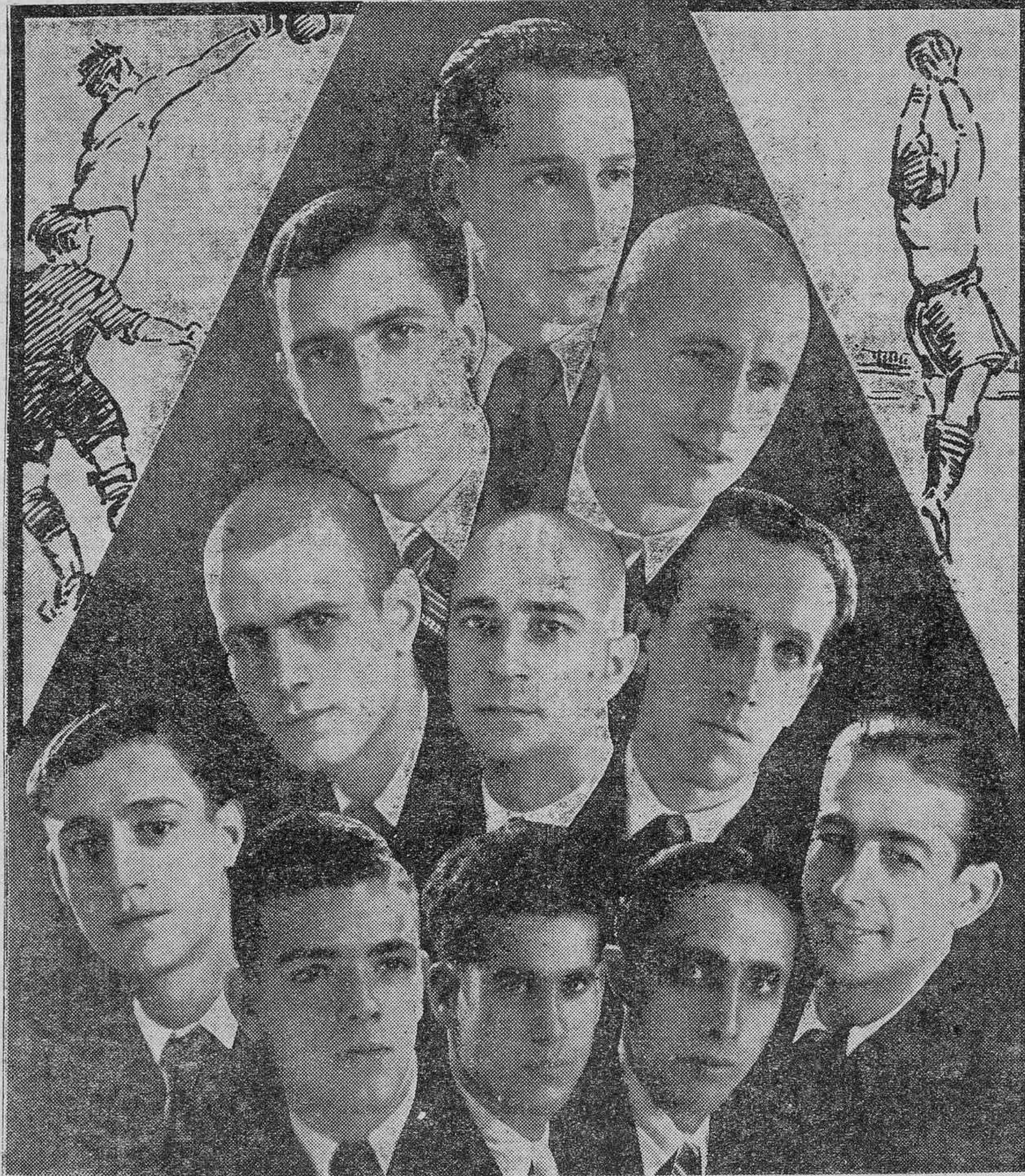
Estos son los once jugadores del Tenerife, que esta tarde, en el Stadium del Club Deportivo, se enfrentarán con los campeones de España. La afición, que siempre recibió con alborozo los triunfos de nuestro equipo titular, tiene hoy puesta toda sus esperanzas en los jugadores tinerfeños, que, representando los colores de la isla han de derrochar los mayores entusiasmos y poner en la lucha todos sus conocimientos técnicos para lograr esa victoria que anhelamos hoy todos los tinerfeños.—(Composición de BENITEZ).