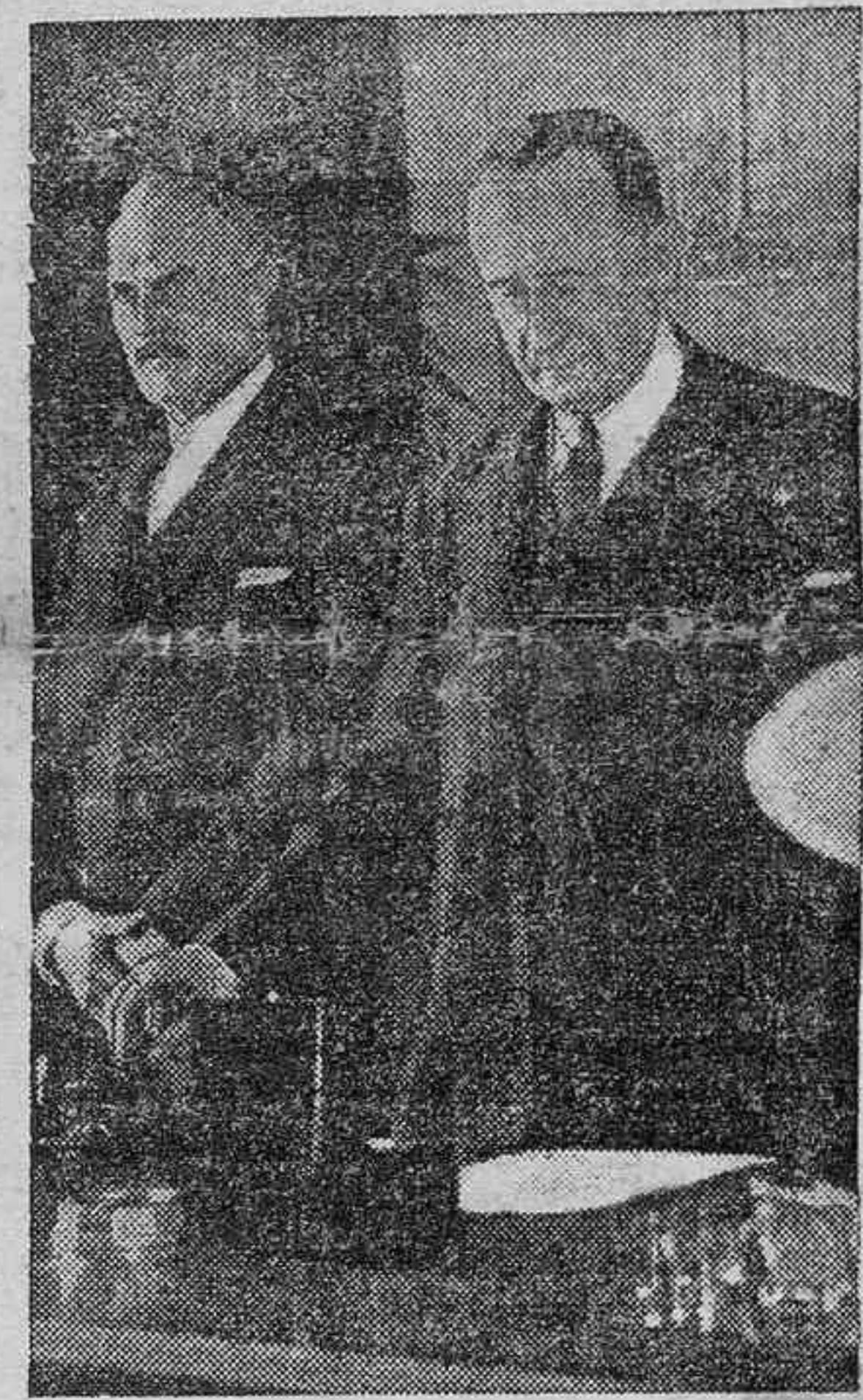
Marconi en la T. S. H. del Vaticano

En una "cirquete" popular de una revista inglesa se hacia esta pregunta: ¿Cuál es el hombre de este siglo que ha prestado un mayor servicio a la Humanidad? La inmensa mayoría de los opinantes se ha pronunciado por Marconi, el descubridor de la telegrafía sin hilos. No hay que olvidar que se trata de Inglaterra. Los ingleses constituyen el pueblo más marinerio del mundo. Su marina de guerra y mercante lleva todavía la primacía, por lo menos, en el número de buques navegando. Y el invento de Marconi ha sido el invento de máxima utilidad para la navegación marítima. Y también para la navegación aérea.