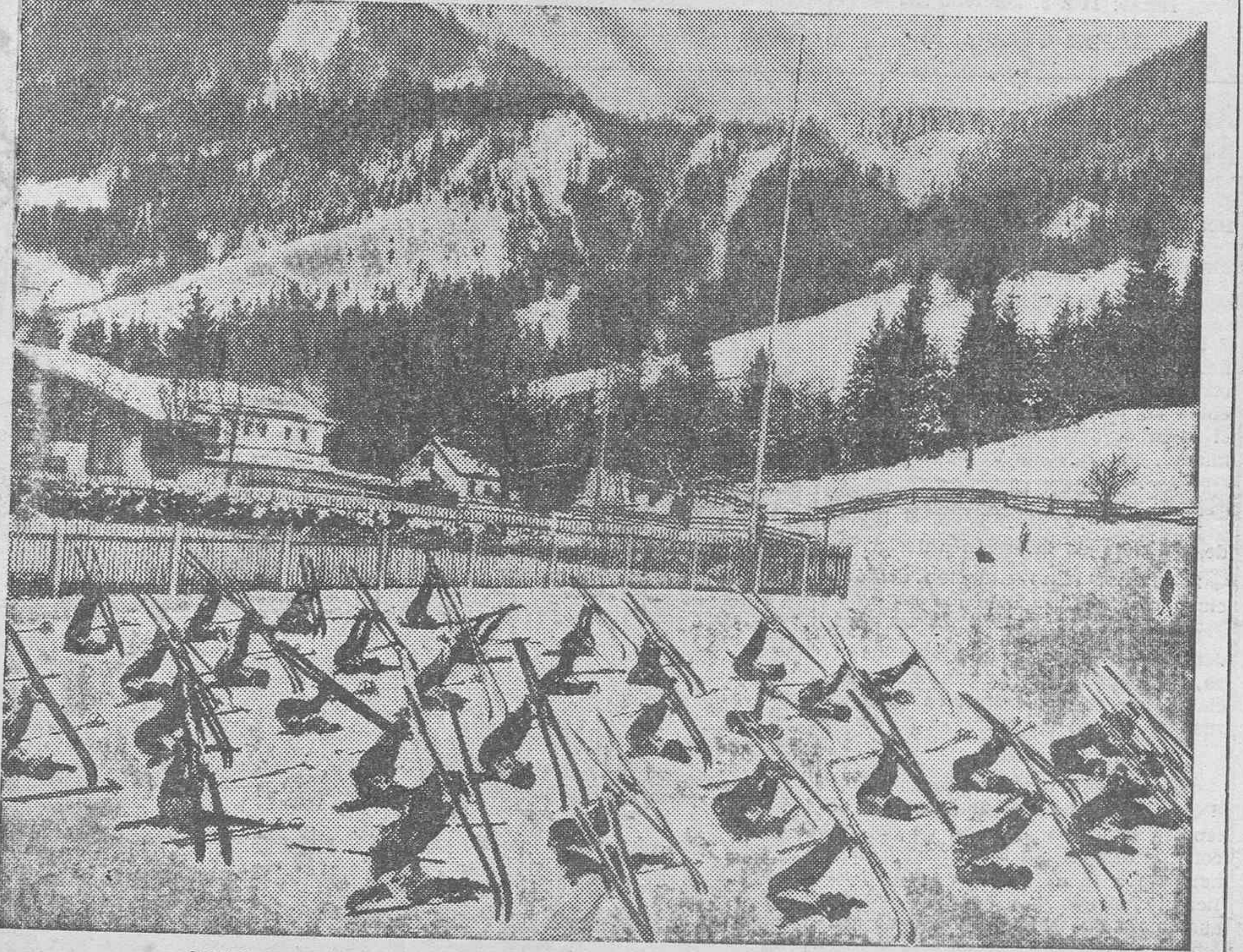
LOS DEPORTES DE INVIERNO.—Ejercicios de esquiadores en los Alpes suizos.

AÑO DE MASCARAS La noche en que empezó el año observé, entre otros detalles, bastantes grupos de máscaras circulando por las calles. Este exceso de antifaces me pareció un poco extraño en una noche tan seria como la de fin de año. Yo soy muy supersticioso y, francamente, hallo mal que se dé comienzo al año con farasas de Carnaval. Pero el caso es que en los bailes del Recreo y Guimera llovia máscaras del cielo como si fueran maná. Se acababz el año viejo, el año nuevo empezaba y junto a mí cierto grupo de mascaritas chillaba. Muchas de ellas eran jóvenes y de gran plasticidad, pero también ví que había una máscara de edad. Y esa fué la que me dijo empleando un cierto dejo: —¡Nijota! ¿No me conoces? —¡Sí! ¡Tú eres el año viejo! NIJOTA.