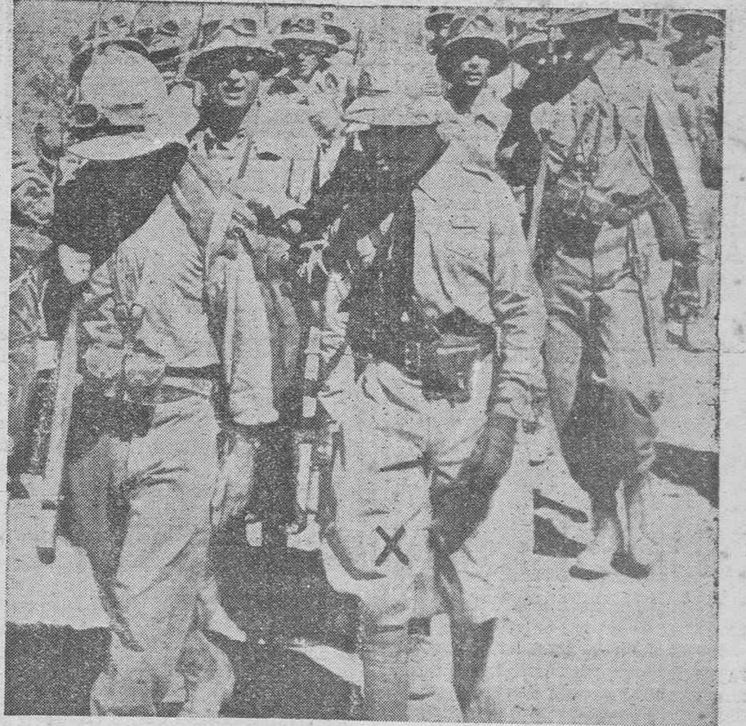
DE LA GUERRA ITALO-ABISINIA.—Combatientes italianos, entre los que figura un miembro de la familia real (X) dirigiéndose al frente de combate.