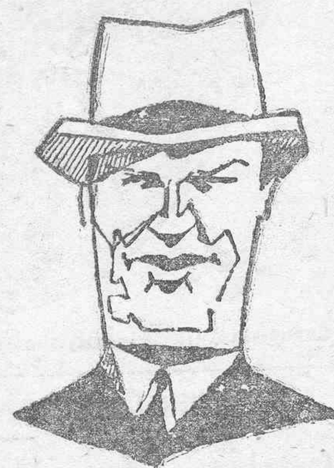
Dempsey en su nuevo aspecto burgués

Así, pues, considerando la influencia que el dinero tiene en sus decisiones, está fuera de duda que volvería al "ring", si, en uno o dos años, se descubre un peleador que logre interesar al público lo bastante para que el negocio vuelva a sus bases primitivas. Pero las indicaciones actuales hacen presentir que pasarán años antes de