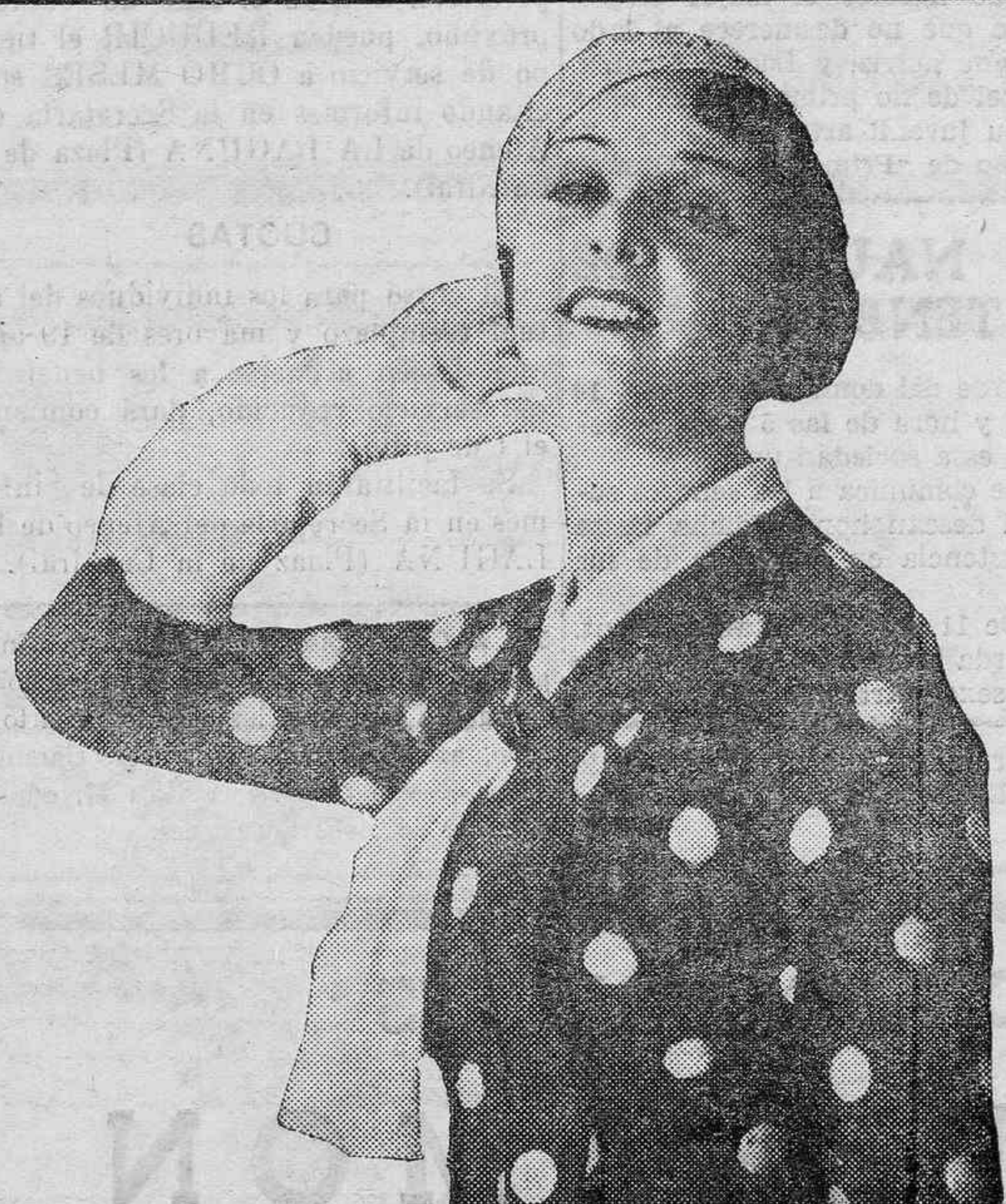
SILUETAS DE HOY