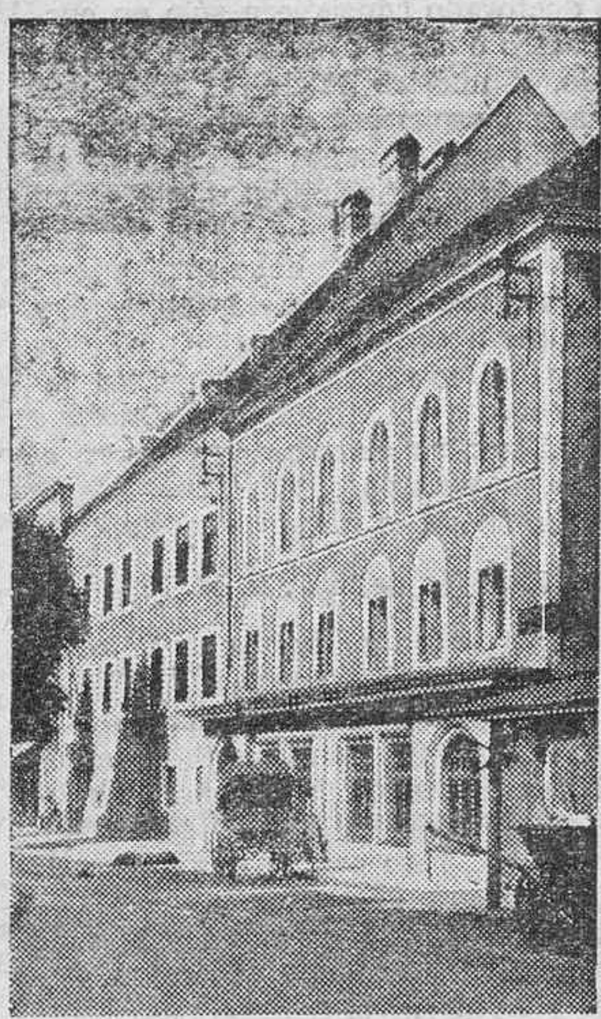
He aquí una simple casa de vecindad, en el pueblo de Braunau. Nunca hubiese sospechado nadie que un día los fotógrafos hicieran un viaje con el exclusivo fin de fotografiarla. Y es que en ella nació Hitler y con ocasión de su cumpleaños los reporteros gráficos ofrecen esta placa a los periódicos

Pero, a pesar de todo esto, Mérida posee el mármol y el granito de Roma más espectaculares de España. Las vértebras de Roma, en esta inconsciente y triste Mérida de nuestros días, con sus mendigos y sus comunistas libertarios, me han dicho de una manera demasiado elocuente todo el horror de su muerte y de su eternidad. Y es curioso darse cuenta de que en Mérida nos encontramos en el año 1933 con que lo más civilizado y lo más moderno, lo más inteligente y lo más humano, no es precisamente lo que pueda decir o pensar el último clérigo agazapado o el último maestro de escuela progresista, sino que es esta desolada meditación del enorme puente de dos mil años sobre las aguas tranquilas del Guadiana.