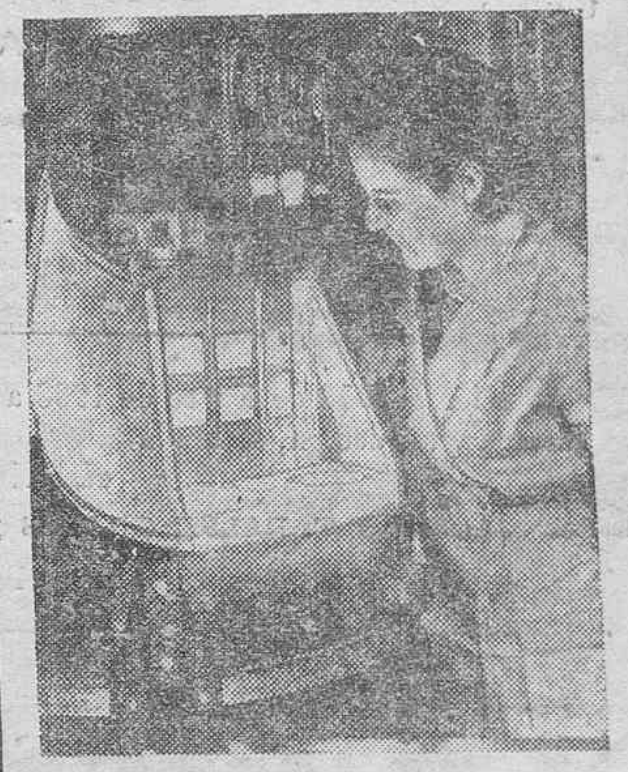
En Chicago se han establecido instalaciones como la que puede verse en la fotografía para que la cara tostada de sol no pierda su colorido. Cuando el rey de los astros—¡ay, qué cursi!—se oculta—cosa que ocurre con frecuencia en Chicago—las muchachas se colocan ante este aparato, toman el sol artificial, pagan la Estación de "tueste" y la piel sigue morena.