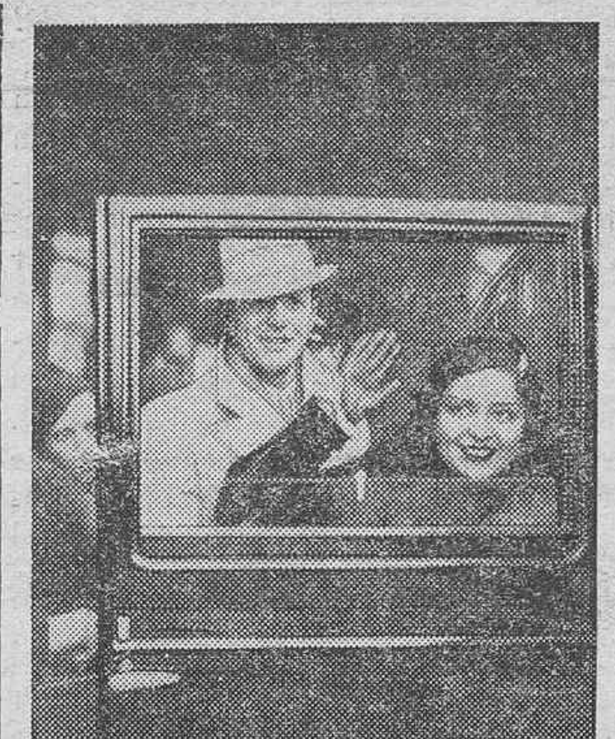
Clara Bow, la "estrella" de Hollywood, sigue su viaje de novios por Europa. Allí la tienen ustedes, en Berlín, con su esposo. El pobrecillo en segundo término. Ella, junto a la portezuela del "auto" saludando a la gente, que le aclama. ¡Y hasta el divorcio!