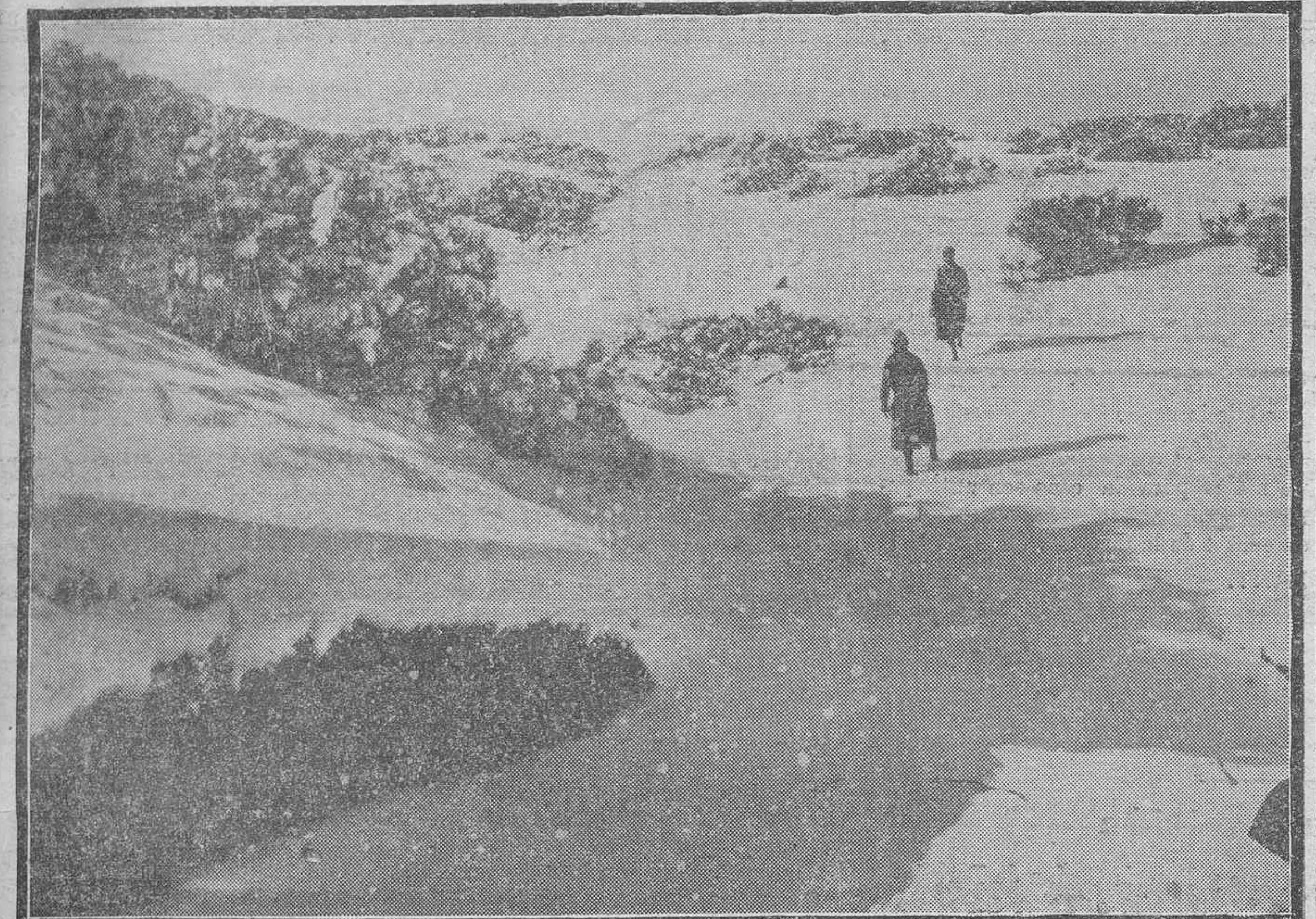
Otra "foto" de la nieve en las Cañadas. Y dos denodados alpinistas dispuestos a recorrer la pista helada a cinco grados bajo cero. En los dos días de esta semana, aunque poco, ha nevado también por allá. Ya lo saben los entusiastas. El domingo próximo se puede seguir patinando. La pista estará formidable. Pero hay que proveerse de esquís y demás accesorios. ¡A patinar en serio!.

está destruido; ni nos interesa la polémica, porque G. A. no es una revista de batalla que aparece en un período de tránsito, de inseguridad, sino una revista redactada para unos sectores internacionales afines, en donde ya el pasado está liquidado de sobra. Lo pasado de moda, no es ya, para nosotros, el ser tolerantes con formas que no pueden vivir en esta época, sino el discutir lo que es viejo y lo que es nuevo.