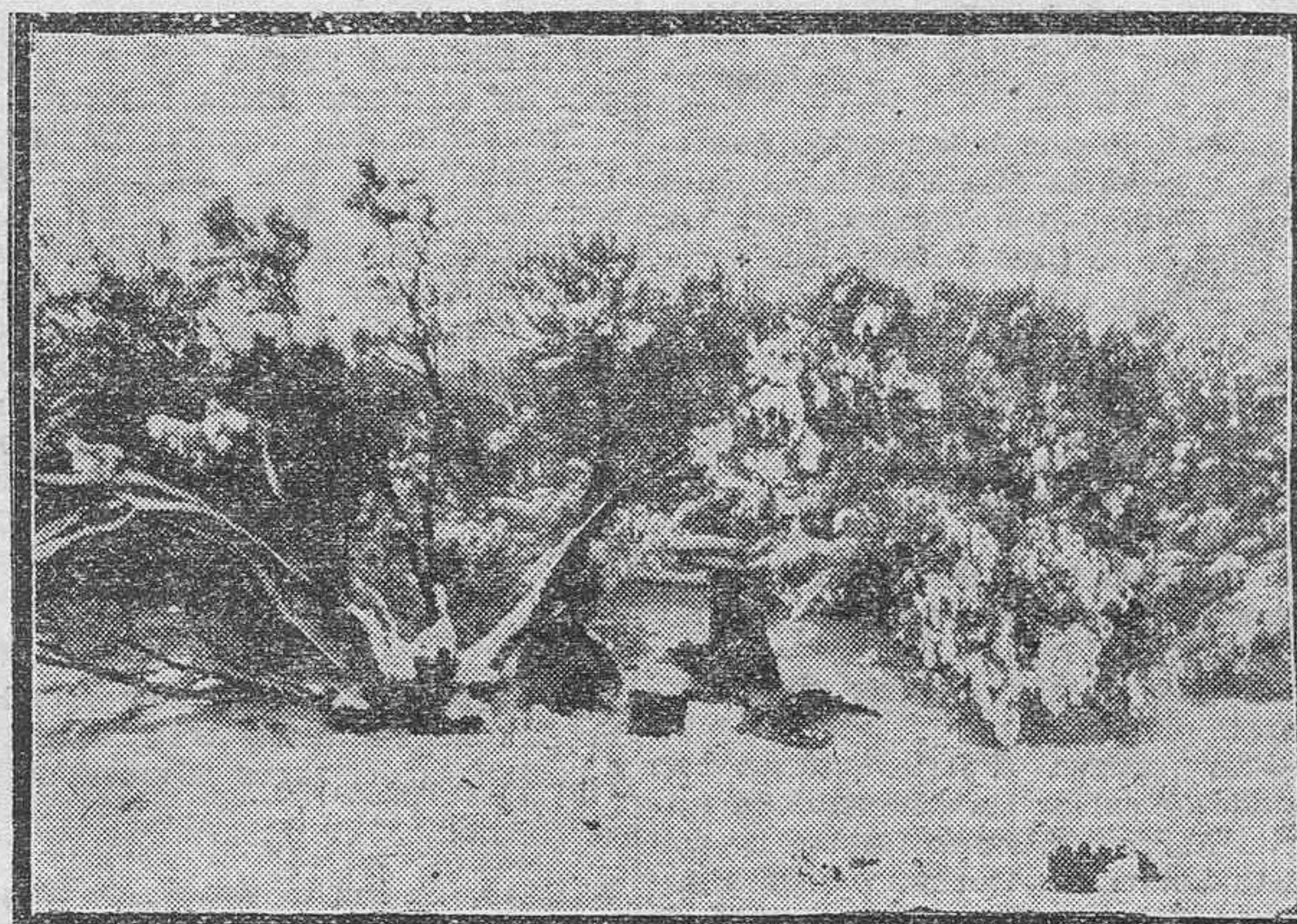
LA NEVADA EN TENERIFE.— Arriba: La nueva pista que conduce al Observatorio de Izaña, cubierta por la nieve. Debajo: Una vista tomada en el Llano de Maja.

La vista quedó concluida para sentencia.