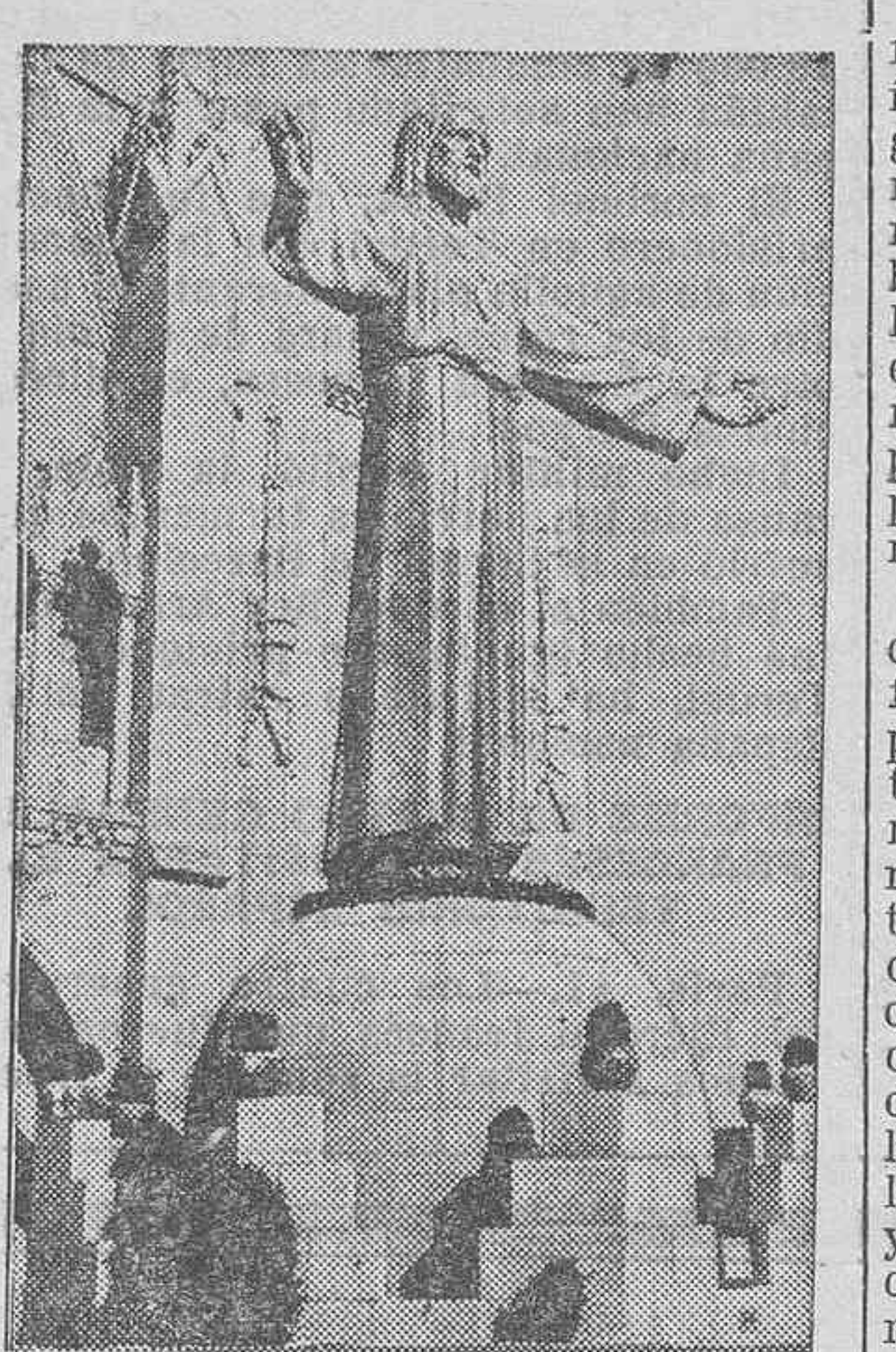
La estatua que coronaba la cúpula de la Iglesia del Tibidabo, que fué destruida por los revolucionarios durante los saqueos de templos.

El vivero es la base de la repoblación, y de saber elegir las especies forestales que allí se cultiven depende el éxito que esas repoblaciones obtengan.