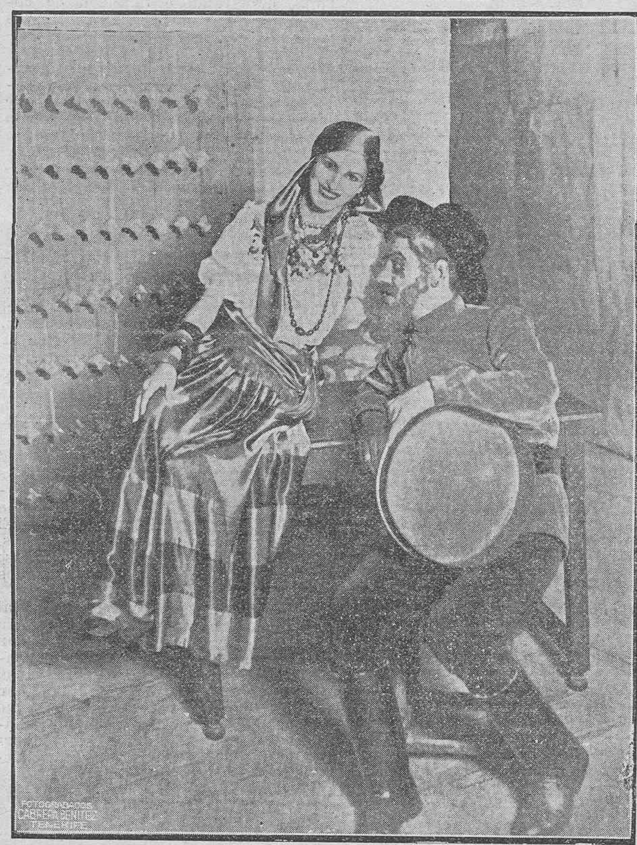
Una escena de la opereta "Los Dragones", que esta noche, a las nueve y media, será representada en el Teatro Guimerá, en honor del Comandante, Oficiales y tripulación del crucero alemán "Deustschland", y en función a beneficio de Asistencia a Frentes y Hospitales.