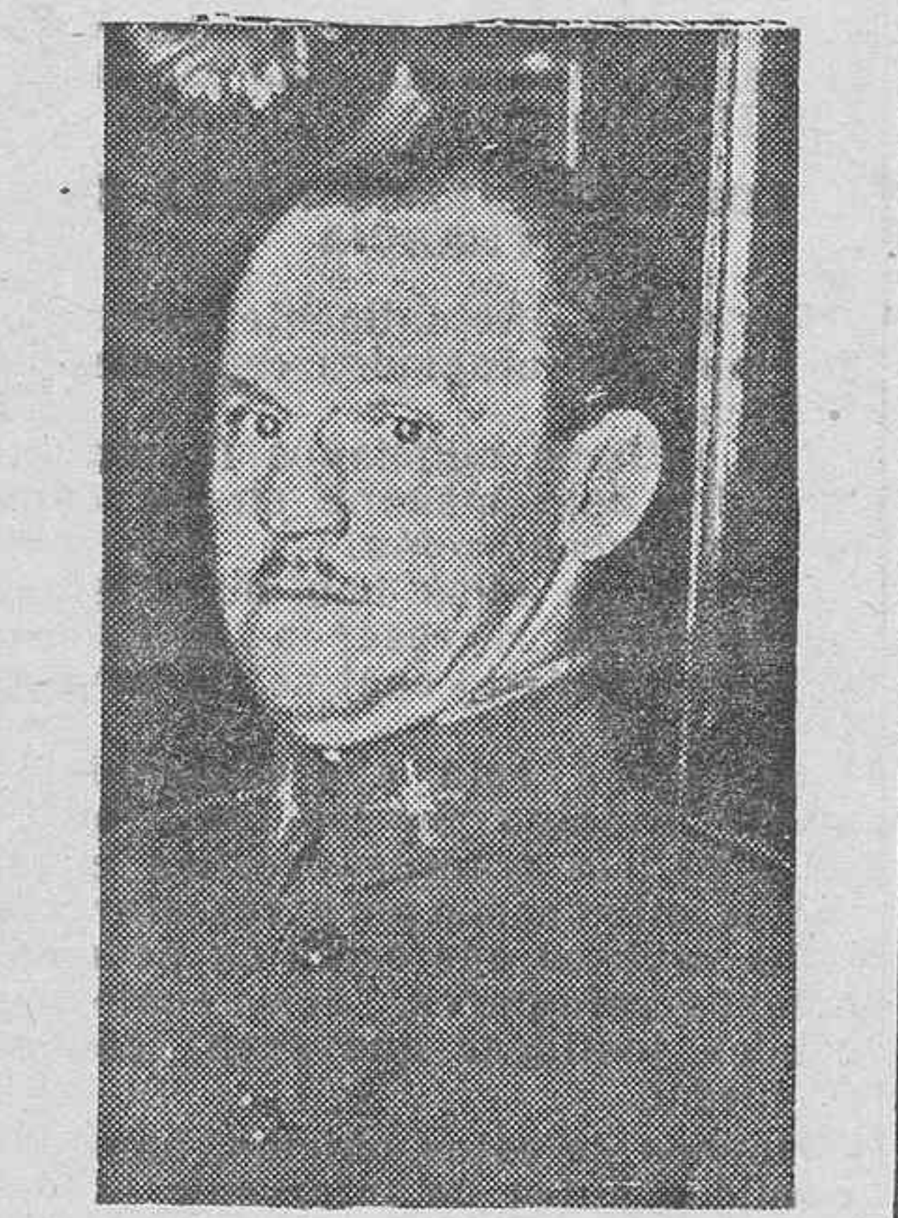
El general Goded, que fué fusilado por los marxistas en la fortaleza de Montjuich.

Los condenados a muerte eran sacados de las celdas comunes y en-