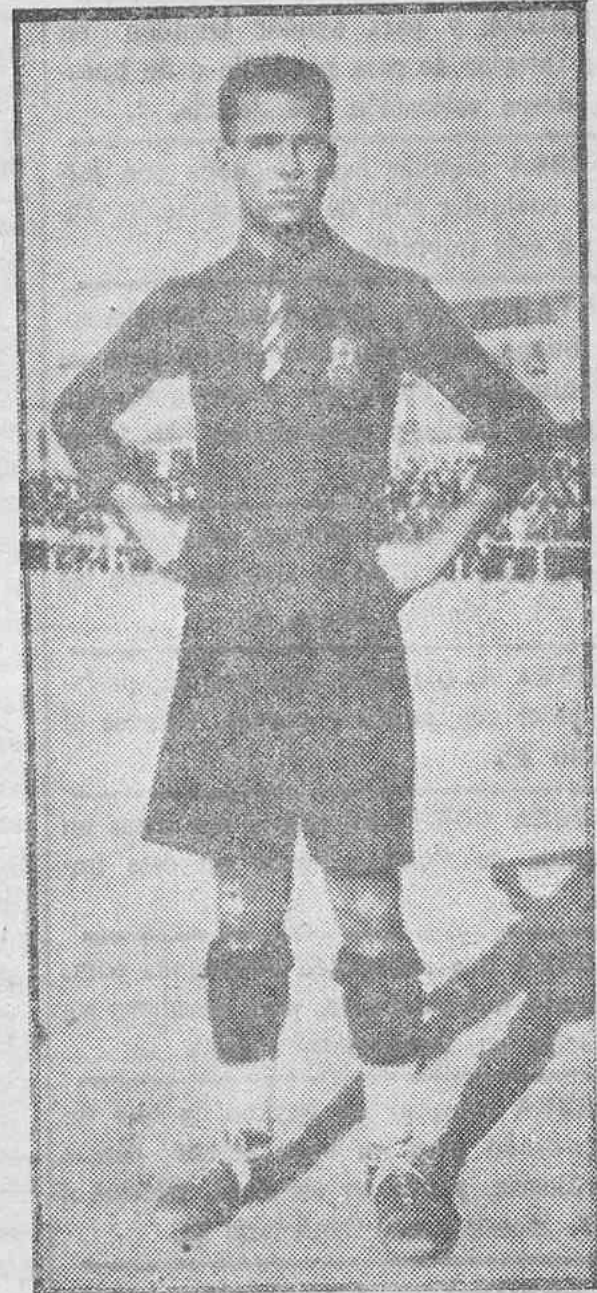
Samitier, el gran jugador barcelonista, que el próximo domingo ocupará el puesto de centro delantero en el «match» internacional España-Portugal.

En la expedición que el «Celta», actual campeón de Galicia, proyecta realizar muy en breve al Sur de América, figurará nuestro paisano Joaquín Cárdenas, uno de los jugadores canarios que más rápidamente ha lo-