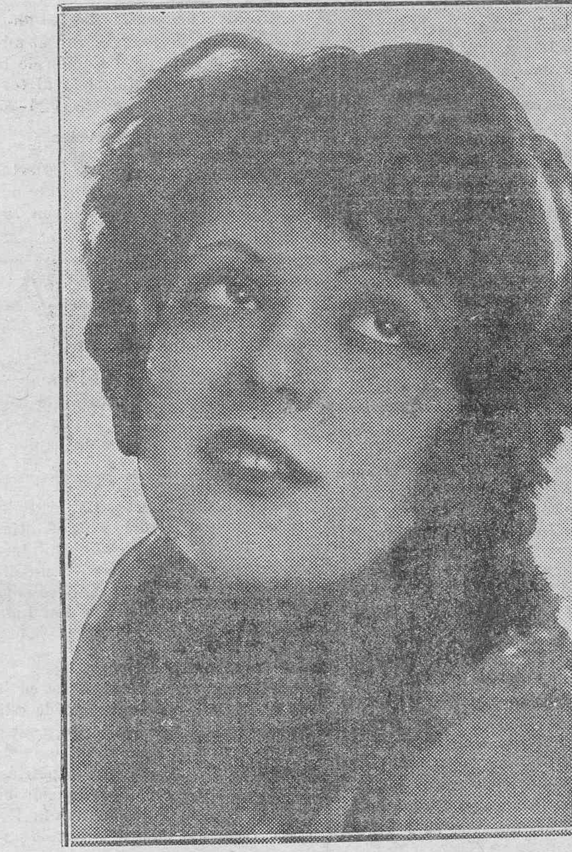
LA CELEBRE ARTISTA CLARA BOW.