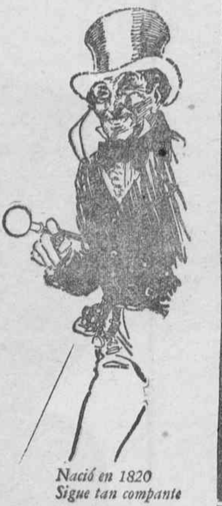
Nació en 1820 Sigue tan compaite

(EN LOS BUENOS CAFES SE VENDE «JOHNNIE WALKER» AL MISMO PRECIO QUE EL WHISKY CORRIENTE)