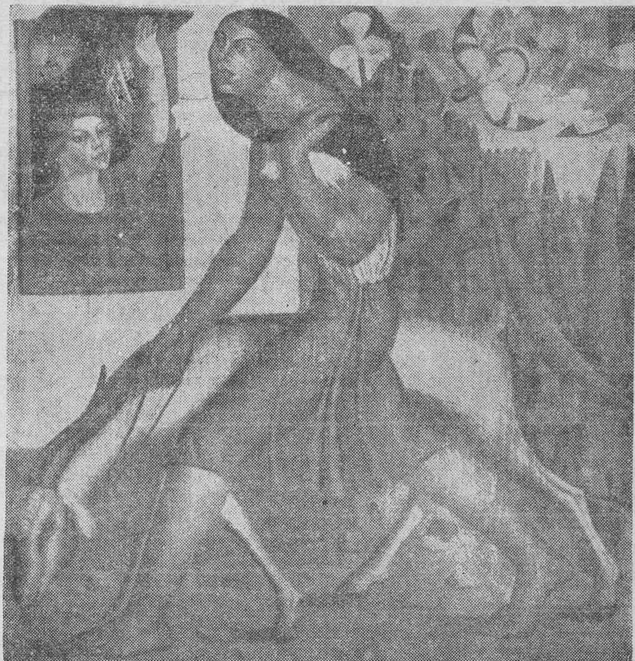
MOTIVO CANARIO.—Por Maruja Mallo.