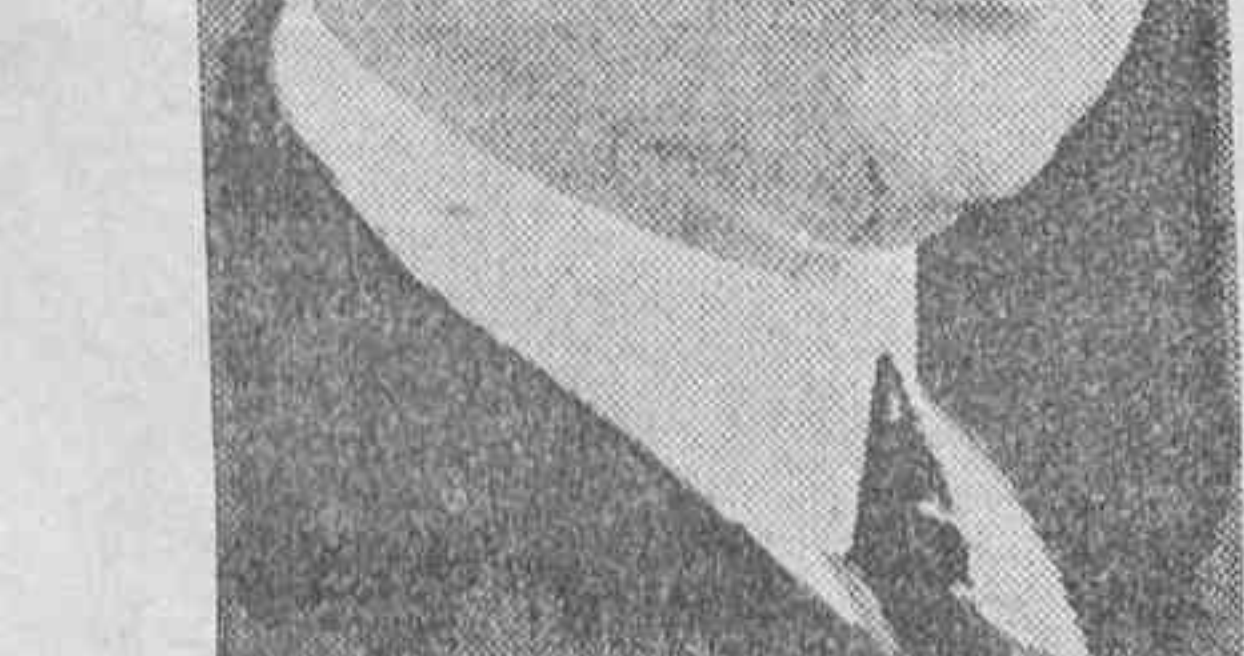
El ministro de Negocios de Polonia, Zaleski, que ha contribuido a evitar la ruptura con Lituania