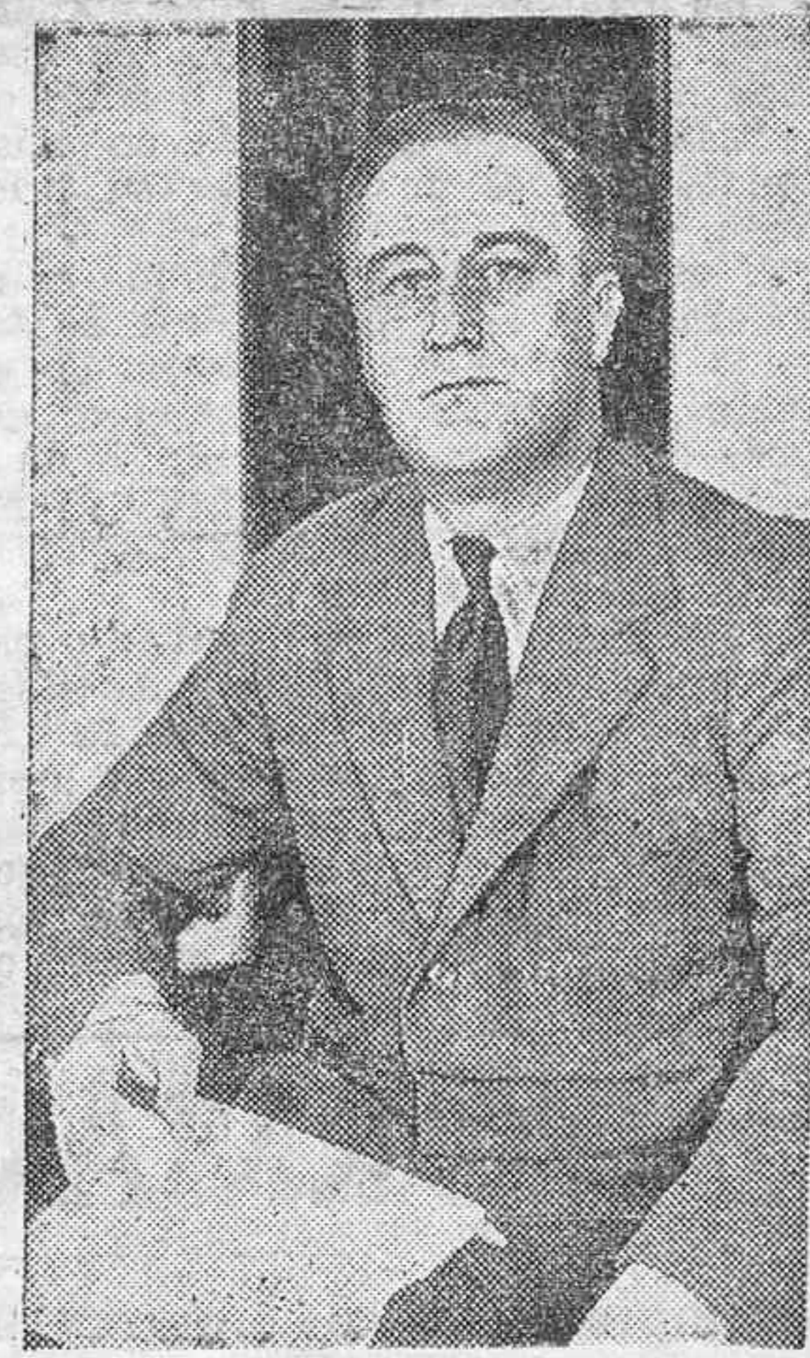
El Presidente de los Estados Unidos, Mr. Roosevelt, cuyo discurso sobre el problema económico y social en Norteamérica ha dado lugar a grandes comentarios.

Nueva York, 25.—Los periódicos comentan el último discurso pronunciado por el Presidente, aunque hay que hacer notar que la Prensa republicana que mantiene una furibunda oposición a la política de Roosevelt ha guardado absoluto silencio sobre el discurso. El "New York Post", simpatizante con el Presidente, escribe que los que se han opuesto siempre a una economía dirigida han seguido contra Roosevelt una campaña de calumnias, sin comprender que su política tiende a lograr el bienestar para el país. Agrega que Roosevelt no hace una política personal, pues sus objetivos son puramente nacionales, y que yerran los que se atreven a considerarle como dictador. El "Times", de la oposición, dice que de la actual depresión y de la situación precaria de ciertas clases sociales, son responsables, no sólo los millonarios, sino también los capitanes de industrias, los trabajadores y el propio Gobierno. Agrega el periódico que en los tiempos