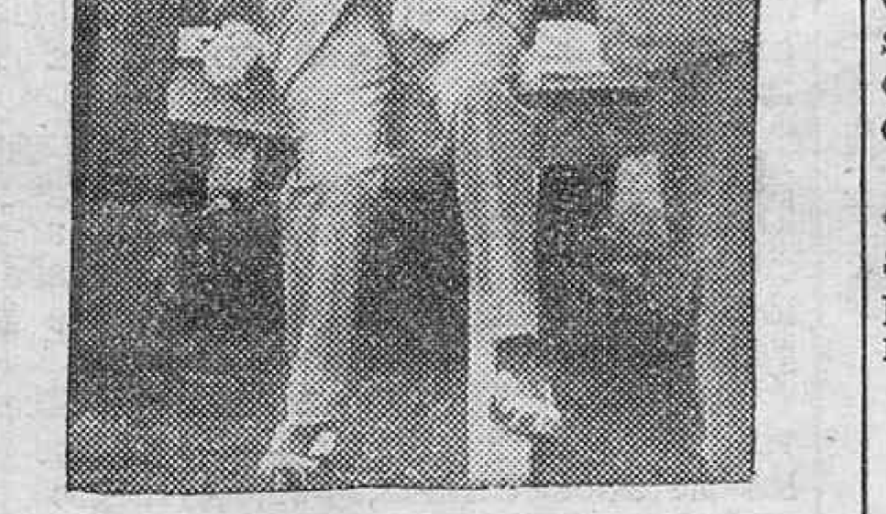
Una de las últimas fotografías de D'Annunzio

La monotonía de la guerra de trincheras no satisfacía, sin embargo, a su espíritu, y como el Gobierno italia-