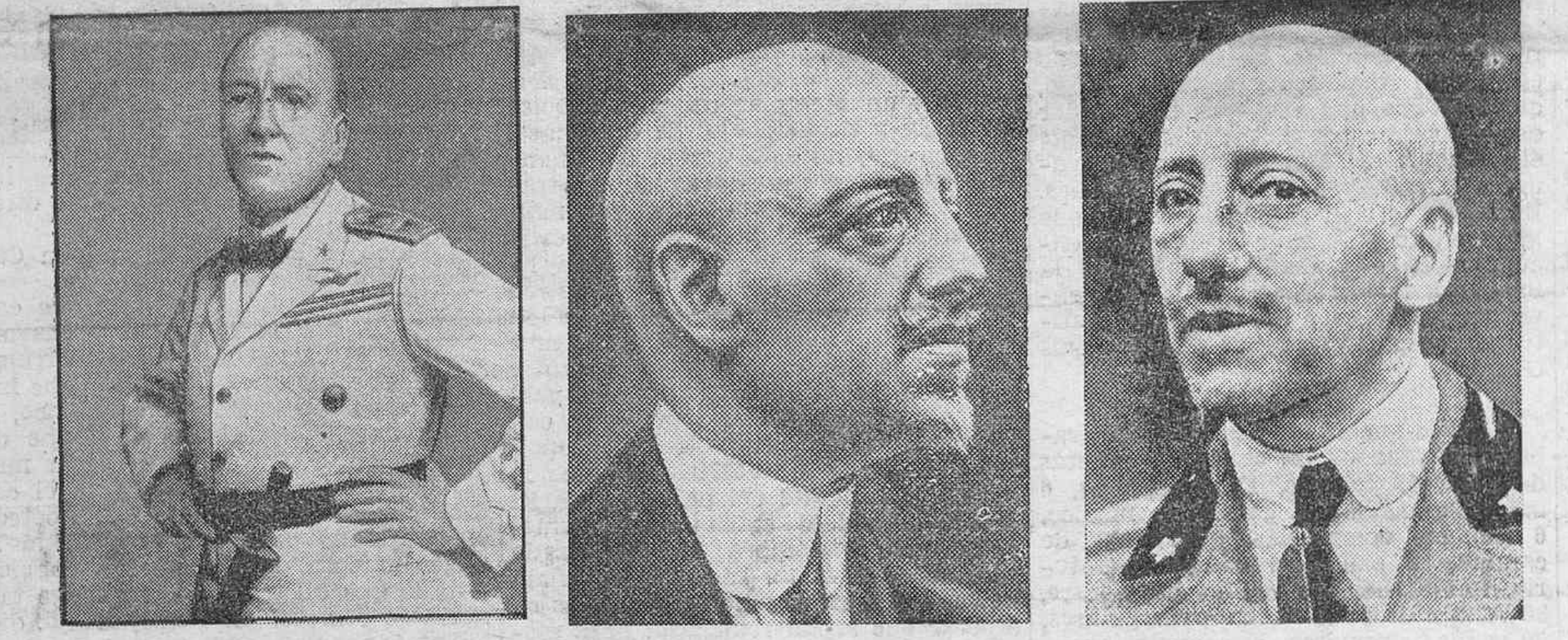
Tres fotografías del célebre escritor en la época de sus aventuras bélicas

La Radio de Roma suspendió anoche su emisión de primera hora para anunciar al mundo la tristísima nueva del fallecimiento del glorioso poeta Gabriele D'Annunzio, tan célebre no sólo por sus obras, que le dieron fama universal, sino por su intervención personalísima en la vida política de su país y por sus hazañas y aventuras durante la guerra europea.