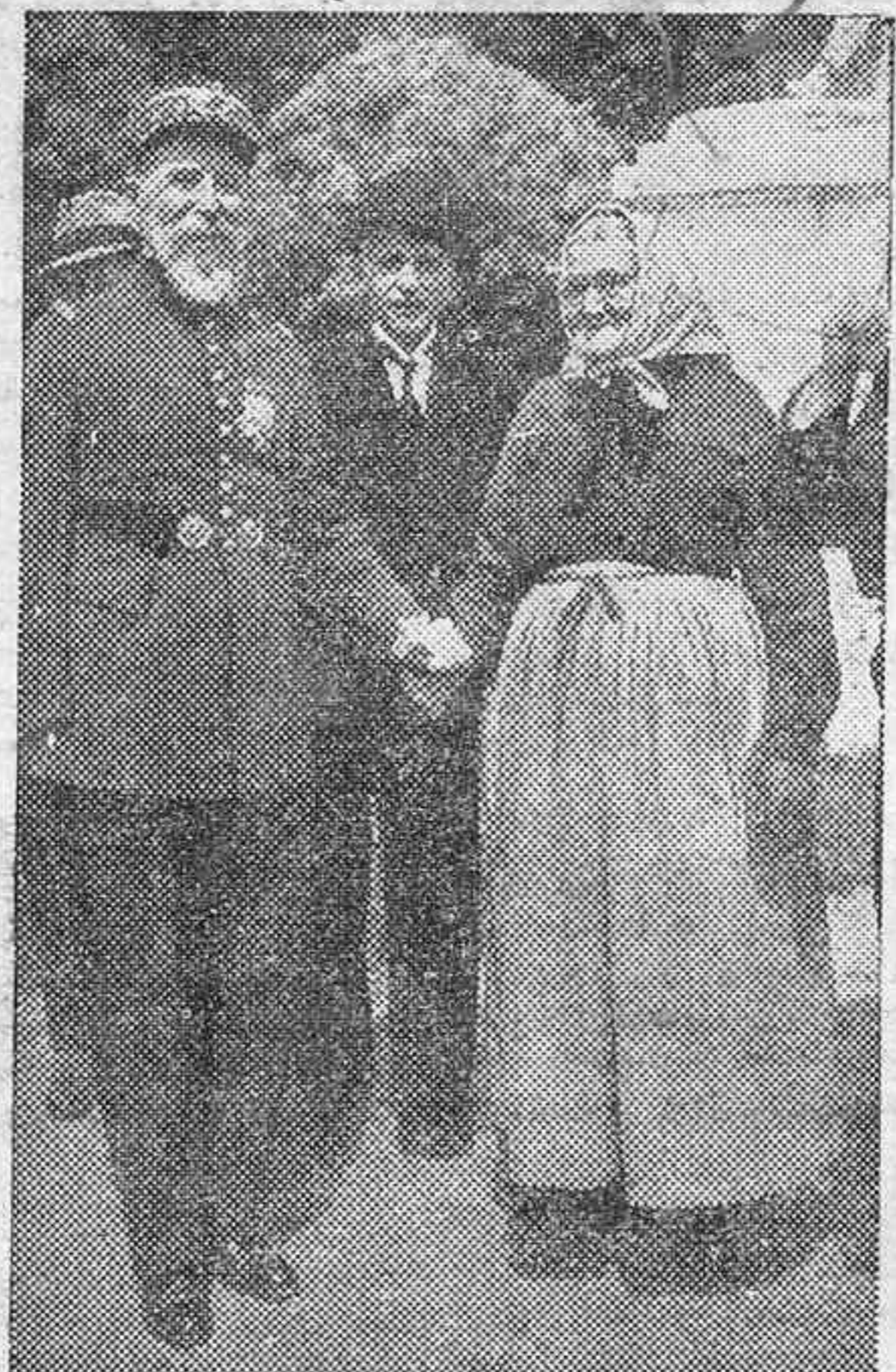
El general francés, Gouraud, que se indica para formar parte del nuevo Gobierno que trata de constituir M. Daladier

París, 9.—El señor Daladier recibió esta noche a los periodistas, a los que hizo las siguientes declaraciones: —La jornada ha sido muy laboriosa y estoy francamente satisfecho. —¿Habrá mañana Gobierno?—preguntaron los informadores. —Espero poder llevar la lista a Palacio al mediodía, sea como sea. Estoy resuelto a ello. —¿Un Gabinete de concentración parlamentaria? —El Gobierno—contestó monsieur