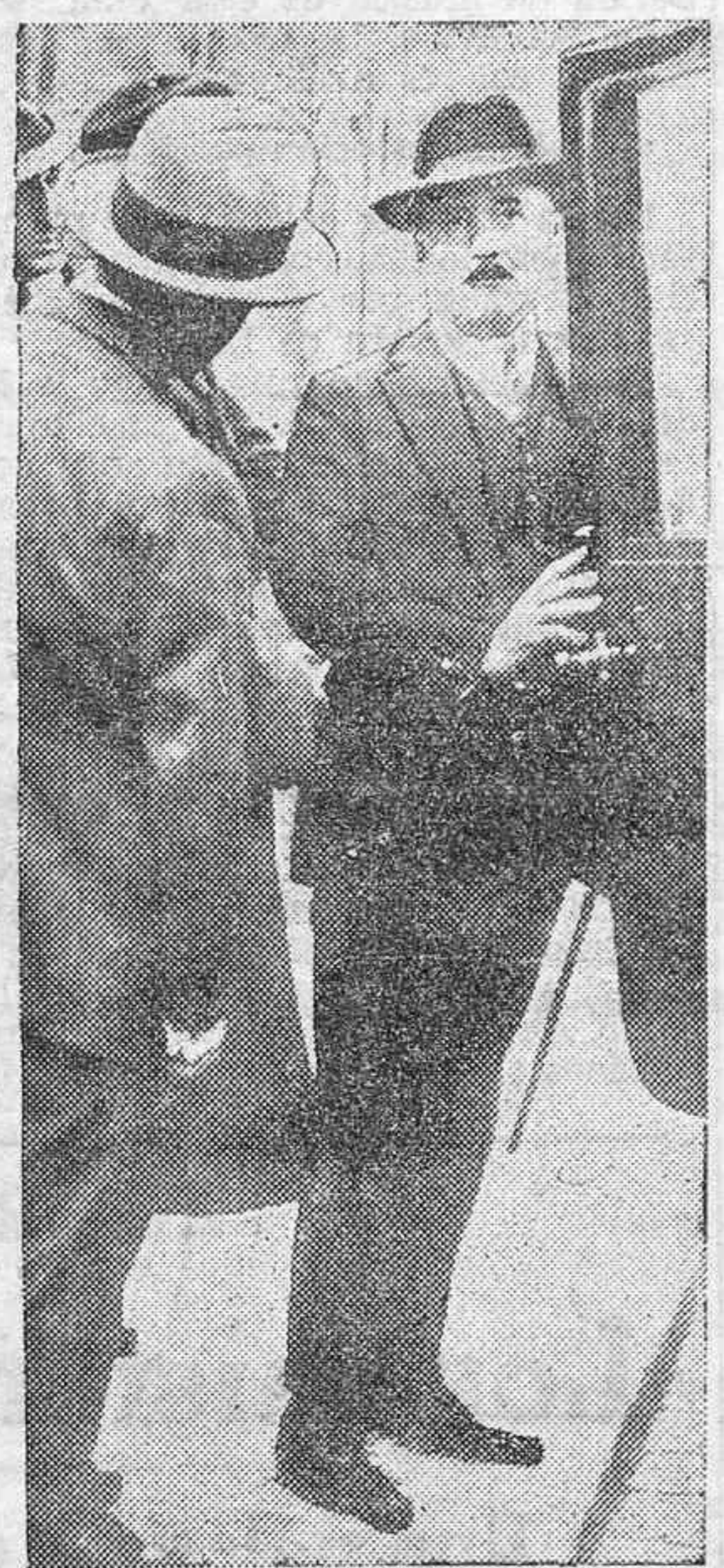
El señor Caillaux, que preside la Comisión del Senado francés, que acordó rechazar por 26 votos contra 6 los proyectos financieros del jefe del Gobierno, señor Blum.

París, 7.—La huelga de metalúrgicos continúa en el mismo estado. Mil setecientos operarios de la fábrica Citroën han firmado un escrito en el que solicitan volver al trabajo. La dirección de las fábricas Rone