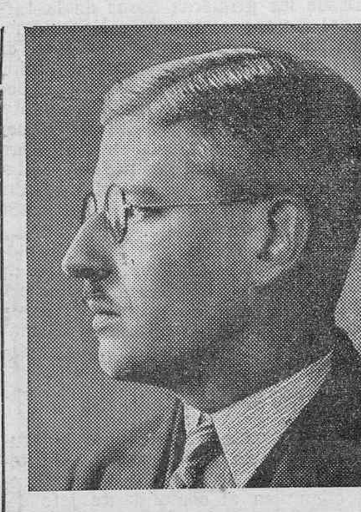
EL CANCELLER SCHUSCHNIGG

No es un Gobierno de partido. Representa una concentración de las energías positivas de Austria.