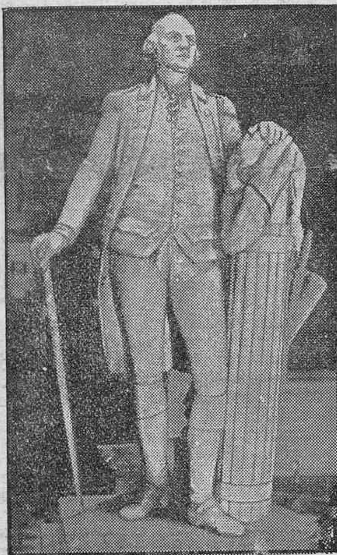
La estatua del primer presidente de los Estados Unidos, Jorge Washington, ante la cual se ha celebrado un homenaje con motivo del 206 aniversario del glorioso fundador de la Constitución americana, bajo la cual se acogen hoy los 200 millones de habitantes de los 48 Estados de la Unión y sus colonias.—El jefe del Gobierno inglés, Mr. Chamberlain, figura hoy de destacada actualidad en la política internacional, retratado en una de sus posesiones de campo mientras reposa de las abrumadoras tareas de su cargo.—El rey del Irak presenciando una gran revista de sus tropas.