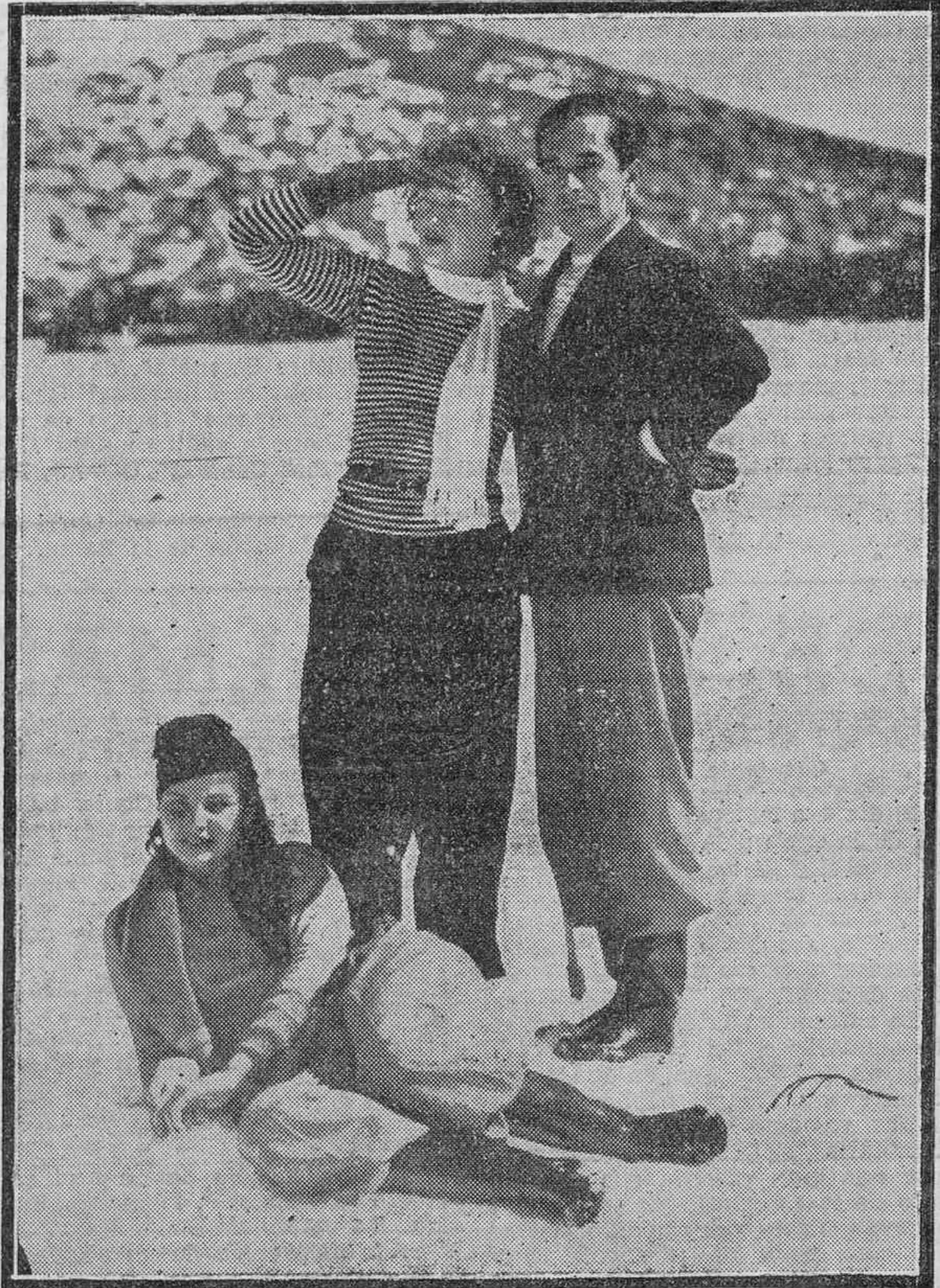
PAISAJES DE LA NIEVE.—(Foto Garriga).