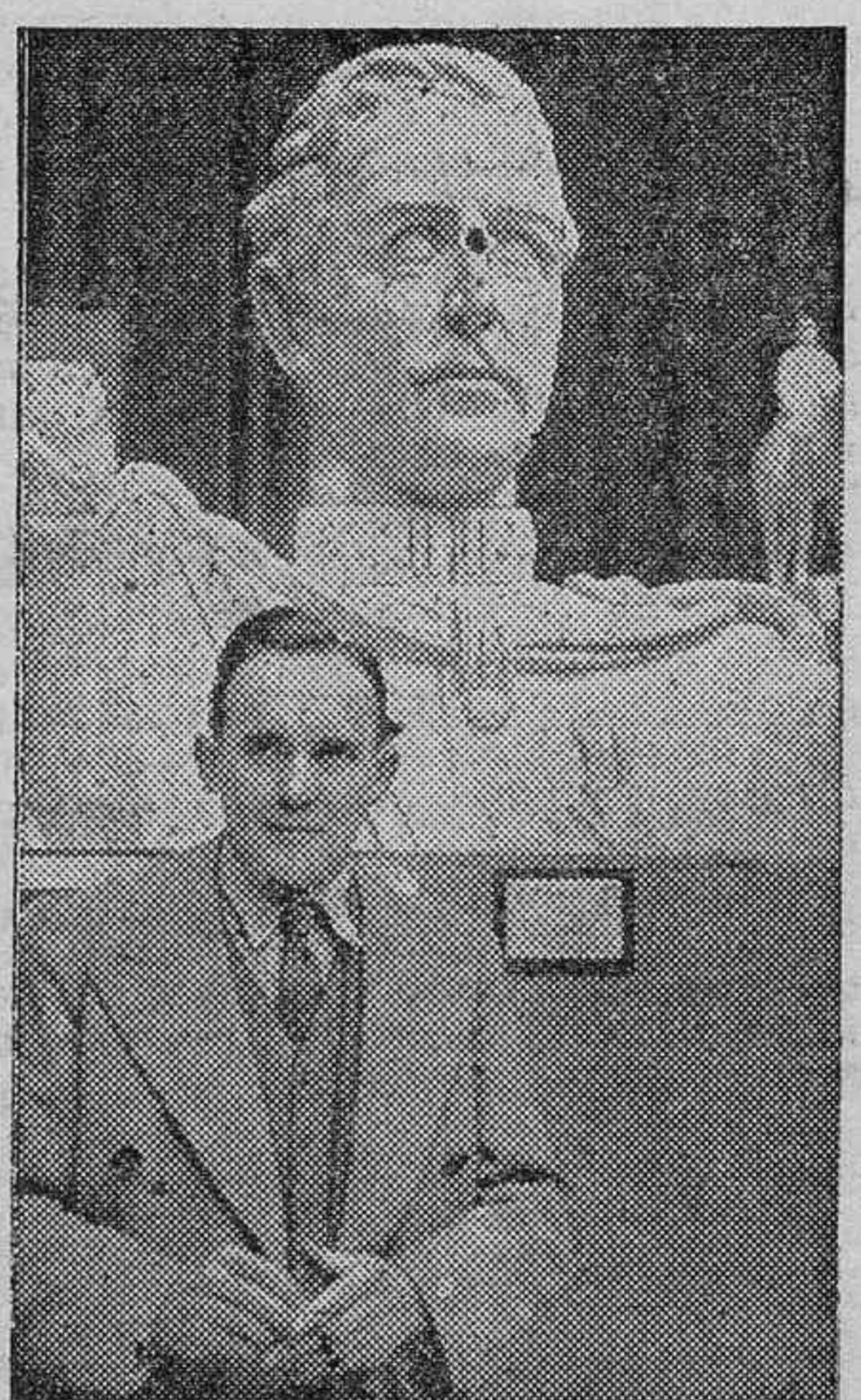
Un detalle del monumento que Francia ha erigido al rey Alberto de Bélgica.

París, 10.—El miércoles próximo será inaugurado en París el monumento al rey Alberto I. Asistirán a la ceremonia el rey