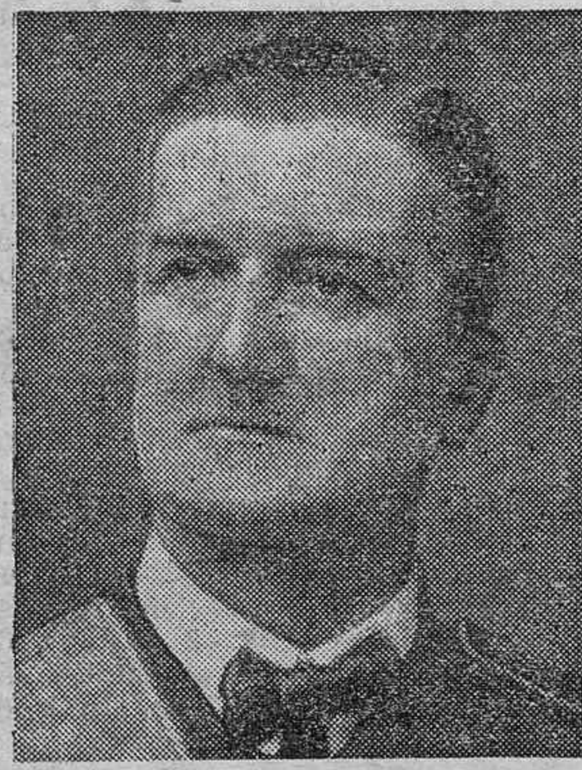
El regente Horthy

También el ministro de Asuntos Extranjeros, general Gómez Jordana, ha felicitado con este motivo al Encargado de Negocios de Hungría en España.