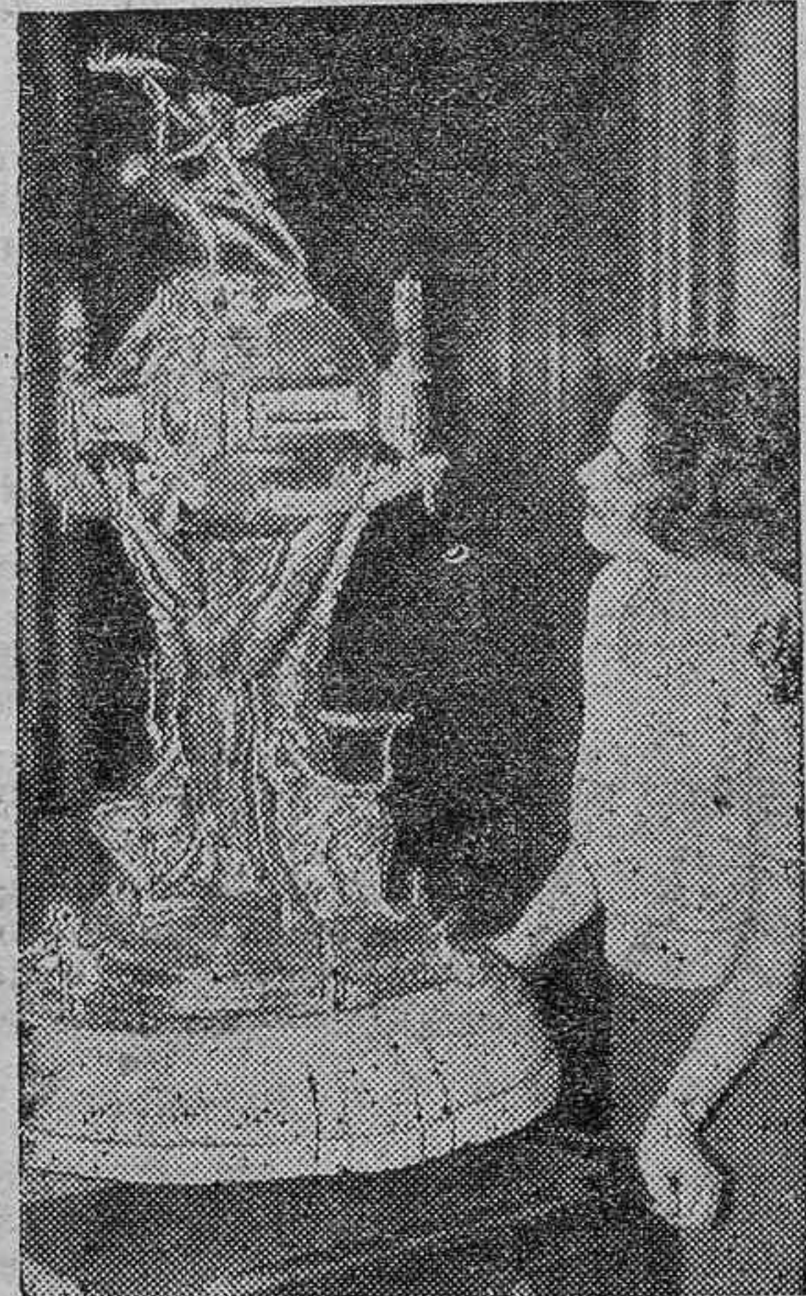
El célebre trofeo "La cinta azul del Atlántico", que detentaba el vapor francés "Normandie", y que ahora pertenece al "Queen Mary", que ha batido el record de velocidad, haciendo la travesía de América a Europa en 3 días y 20 horas

El "Daily Herald" sostiene, por el contrario, que ha estado a punto de cerrarse violentamente una puerta, y reproduce extensos pasajes del