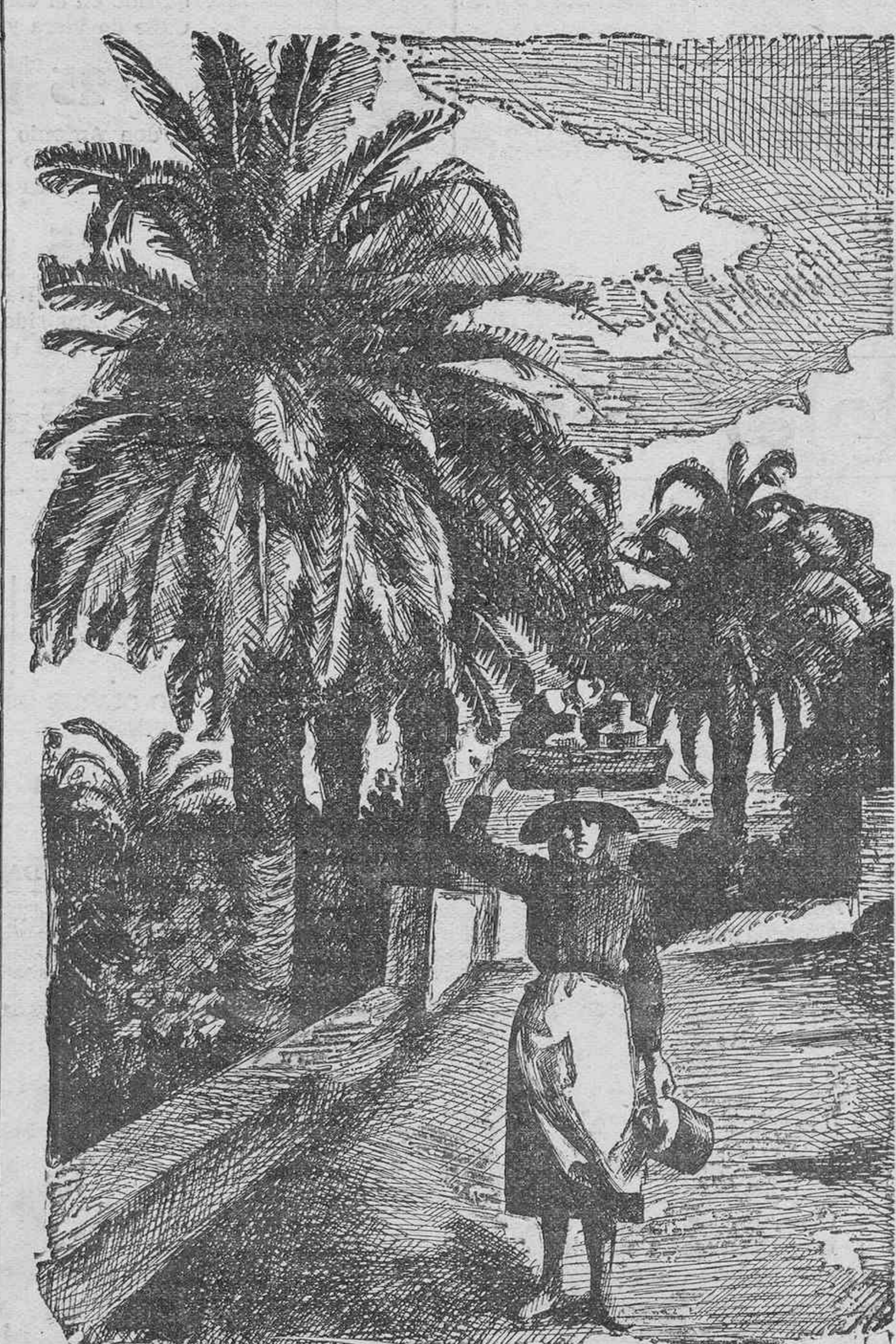
"Son las lecheras, casi siempre, pobres mujeres que de ese trajar, carretera arriba, carretera abajo, han hecho una industria afanosa, de la que, en muchas ocasiones, vive su humilde hogar."

Una, procurar que quede un resquicio, una puerta franca para que, con todas las garantías exigibles, las lecheras que se hallen dispuestas a cumplir honradamente su función y a ejercer su industria con sujeción a las normas que se dicten, puedan hacerlo con preferencia a los elementos nuevos que hayan de intervenir en la organización. Otra, que la reorganización sea lo que debe ser: una reforma, una transformación completa del actual estado de cosas, y una solución completa del problema, en su aspecto sanitario, que es el principal. Y otra, por último, acaso la