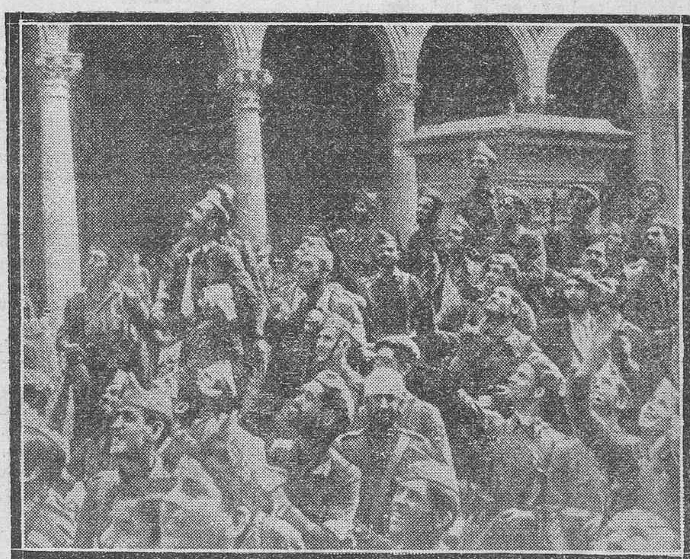
LOS DEFENSORES DEL ALCAZAR.—Una escena en uno de los patios exteriores del Alcázar, en la que se ven tropas nacionales y alguno de los defensores, saludando a los aviones del Ejército.

A poca distancia, encontró el caudillo a una mujer joven, rubia, de cara demacrada. Llevaba en sus brazos un niño de tres semanas, nacido poco des-