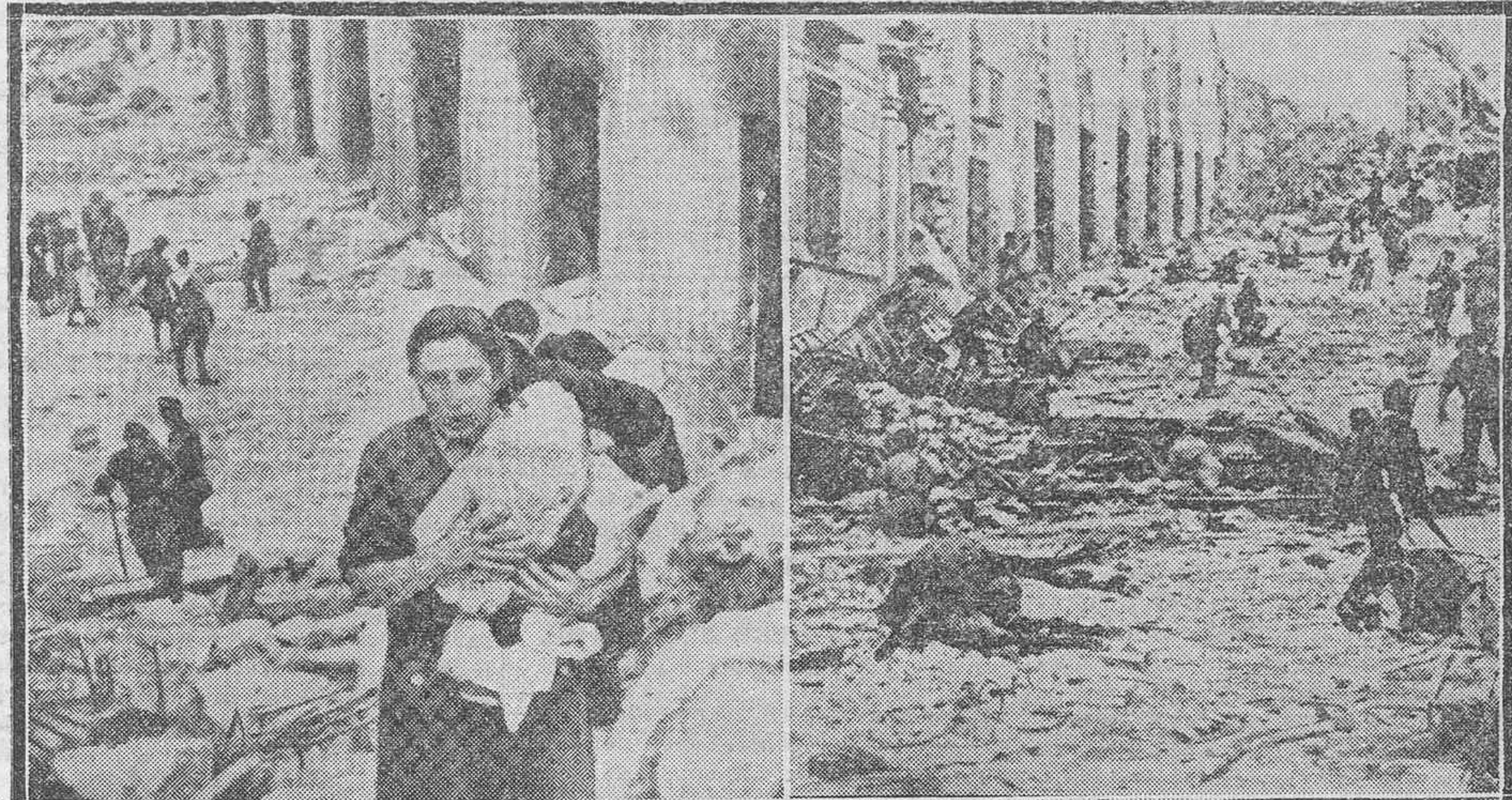
Una de las mujeres supervivientes del sitio del Alcázar, llevando un paquete de alimentos traído por las fuerzas nacionales libertadoras, mientras se abre camino con dificultad por entre los escombros del destruido Alcázar. Al fondo se pueden ver tropas en busca de posibles tiradores comunistas ocultos. Las avanzadas de las tropas nacionales durante la toma de Toledo, abriéndose camino en dirección al Alcázar.

Sucesivamente iremos dando a conocer a nuestros lectores cuantos detalles y gestiones se relacionan con la patriótica iniciativa del señor Ascanio, al cual, como a sus compañeros del Patronato, ofrecemos incondicionalmente las columnas de nuestro diario para cuanto contribuya a la feliz realización de dicha empresa, que de seguro contará con el entusiasta y decidido apoyo del país.