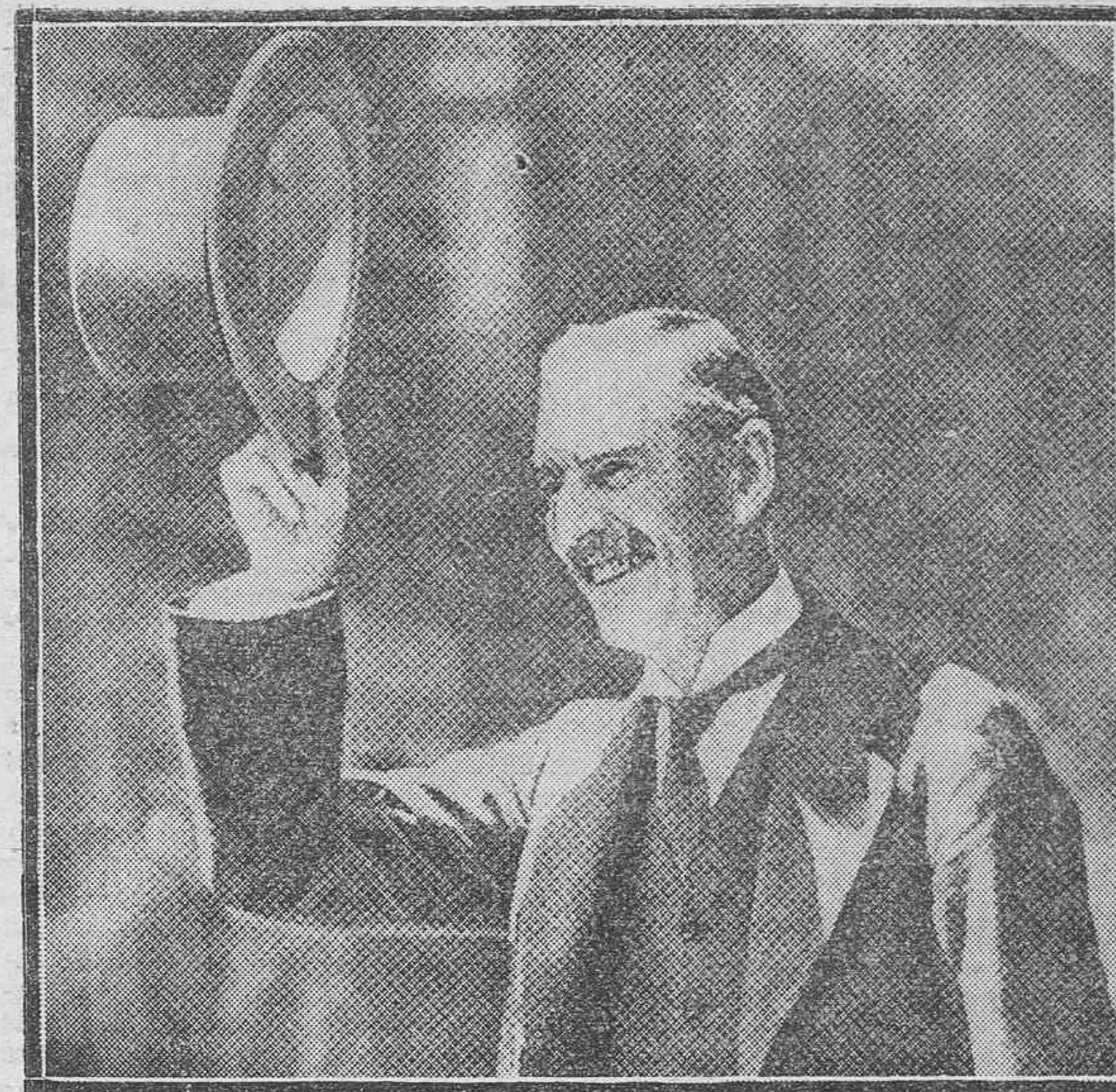
EL JEFE DEL GOBIERNO INGLES, MR. CHAMBERLAIN

"La situación es grave, pero no desesperada" "No hay país ni Gobierno que desee la guerra"