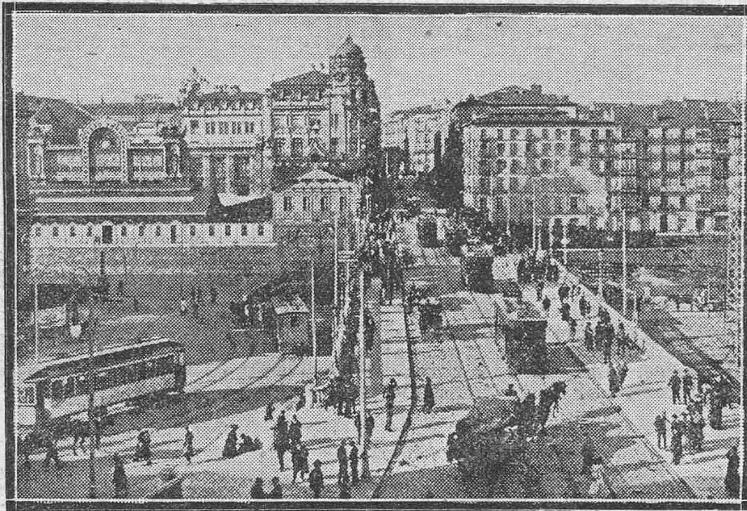
LA OFENSIVA NACIONALISTA EN VIZCAYA.—Un detalle de Bilbao, la importante capital vizcaína, que según las noticias de ayer ha sido bombardeada por los aviones nacionalistas. Después del bombardeo el Gobierno vasco se reunió para tratar de la grave situación creada por el avance de las tropas nacionalistas, que ayer se han dedicado a consolidar las estratégicas posiciones últimamente conquistadas.