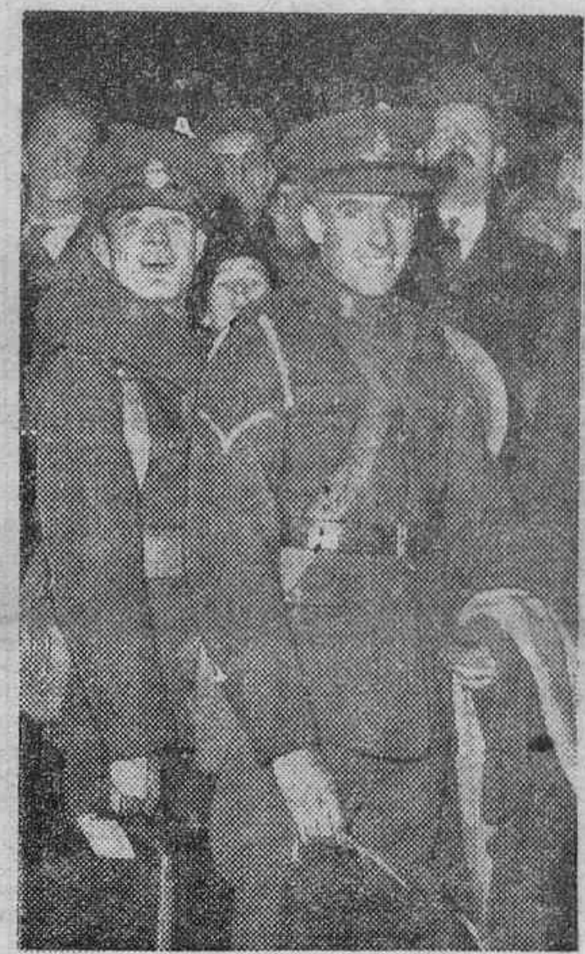
EL PLEBISCITO DEL SARRE. Algunos soldados ingleses pertenecientes al contingente de ocupación del Sarre durante la celebración del plebiscito llegan alegremente a su punto de destino.