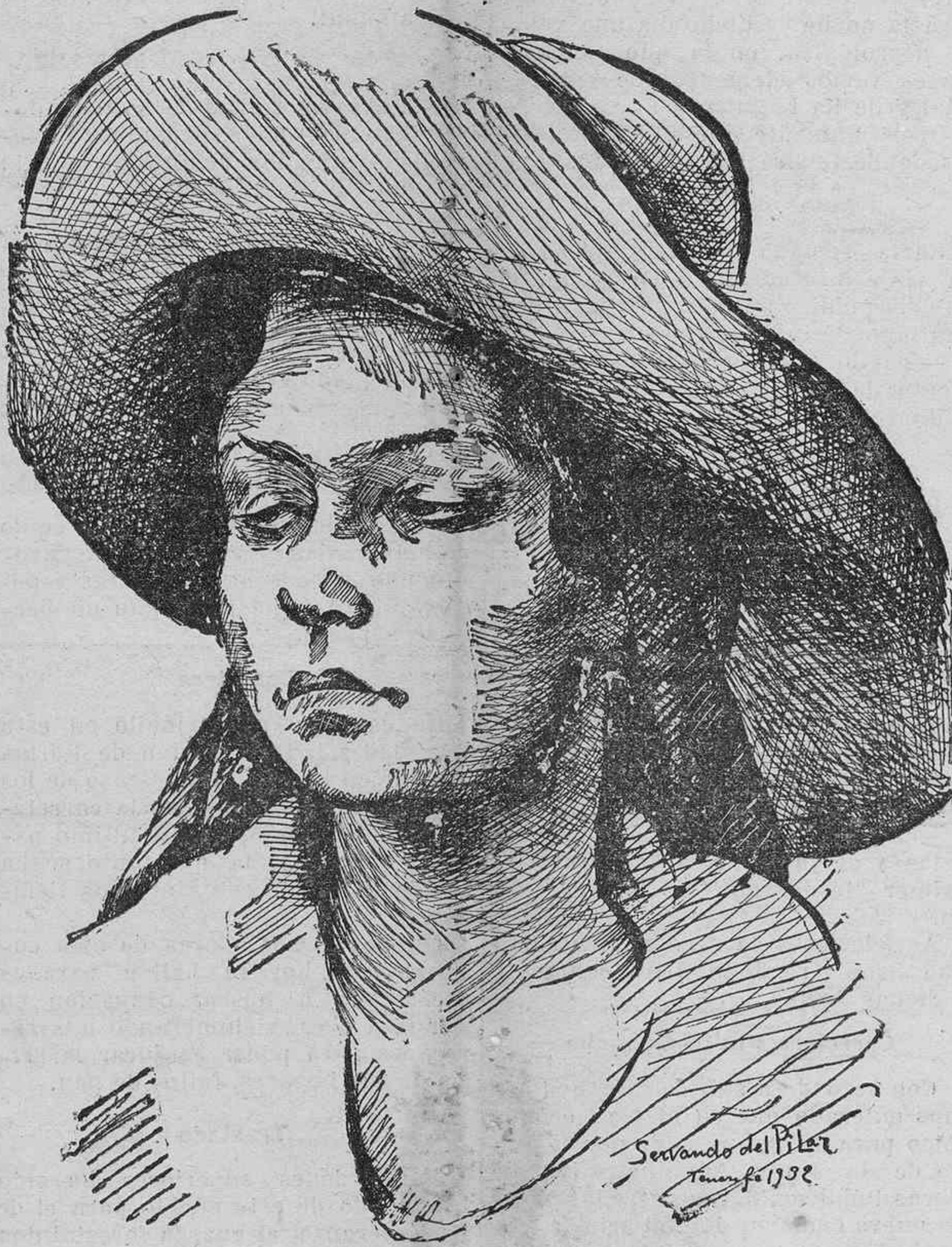
CAMPESINAS TINTERFENAS.—Apunte de Servando del Pilar.