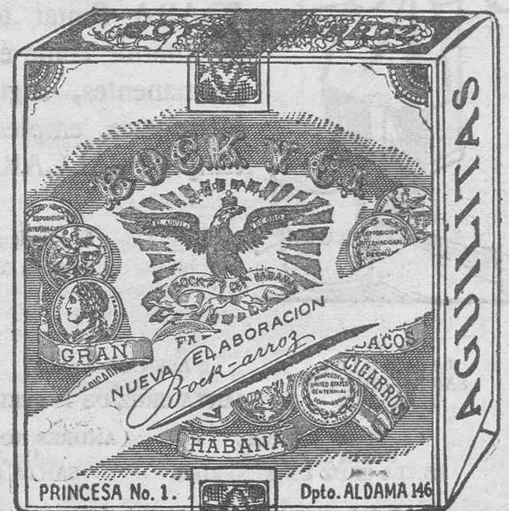
LABORADO CON LAS MEJORES RAMAS DE CUBA

VEAN LOS ÚLTIMOS MODELOS RECIBIDOS EN TODOS CON EL MECHECO DOBLE ECONOMICO EXPUESTOS EN EL EDIFICIO DE LA CENTRAL DE ELECTRICIDAD DE LA UNION ELECTRICA DE CANARIAS S. A. NO OLVIDEN QUE COCINAR CON GAS, EQUIVALE A LIMPIEZA, COMODIDAD ECONOMIA