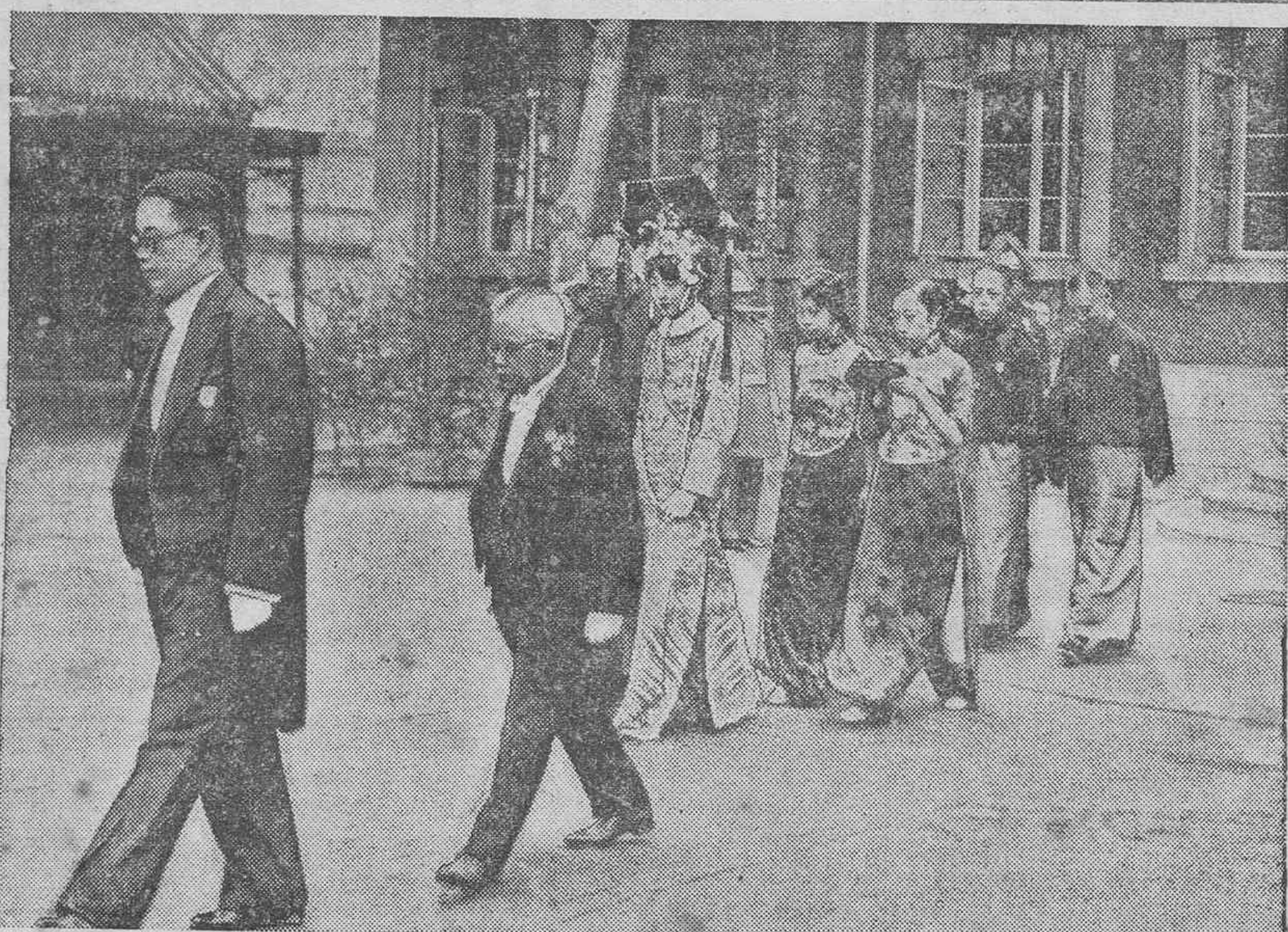
LOS EMPERADORES DE MANCHURIA DIRIGIENDOSE A HSIN-KIN PARA ASISTIR A LA PRIMERA AUDIENCIA OFICIAL, ACOMPAÑADOS DEL MINISTRO DEL INTERIOR Y ALTOS DIGNATARIOS DE LA CORTE.

Por último, da alientos a la floreciente Sociedad para que este ciclo de conferencias no sufra interrupción, pues es la más evidente prueba de cultura. Hizo la presentación del conferen-