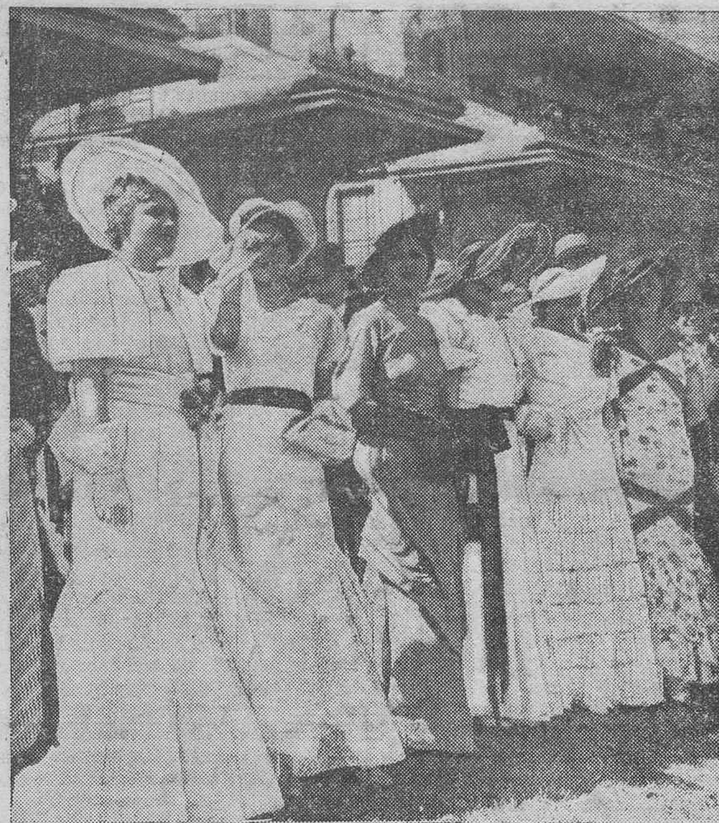
LA MODA EN LAS CARRERAS.—Los últimos modelos vistos en las famosas carreras de Auteuil, donde se han dado cita las más elegantes mujeres de Francia.