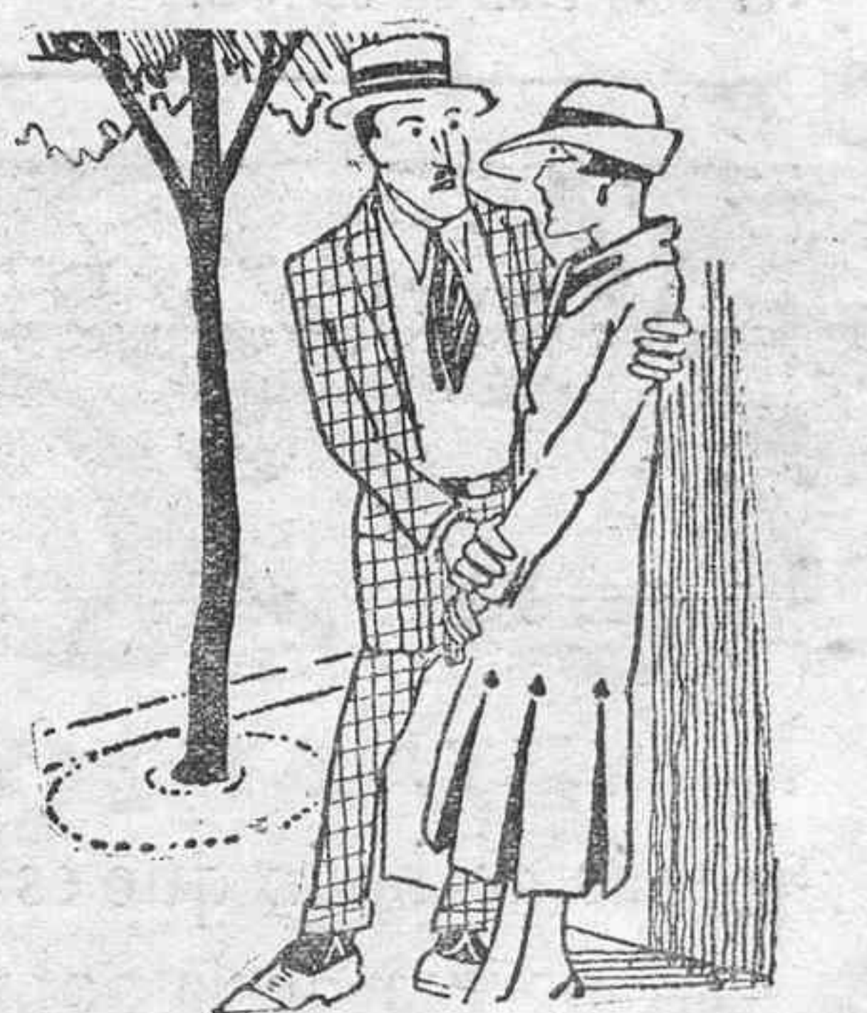
El amor y el deporte

Un poco de agua para lavarlo; un poco de cuidado para los jardines que le rodean y reponer las cadenas que faltan en su basamento, que hace días era solamente una, pero no sé si ya serán más. ¿Es mucho lo que pido para ese busto que se erigió para honrar la memoria de un héroe y se halla expuesto a las miradas de casi todos los turistas y viajeros que llegan al puerto de Santa Cruz? Creo que no. Y creo, además, que tampoco sería excesivo arreglar todos los jardines del paseo y dotarle de unos cuantos bancos más de los que tiene,